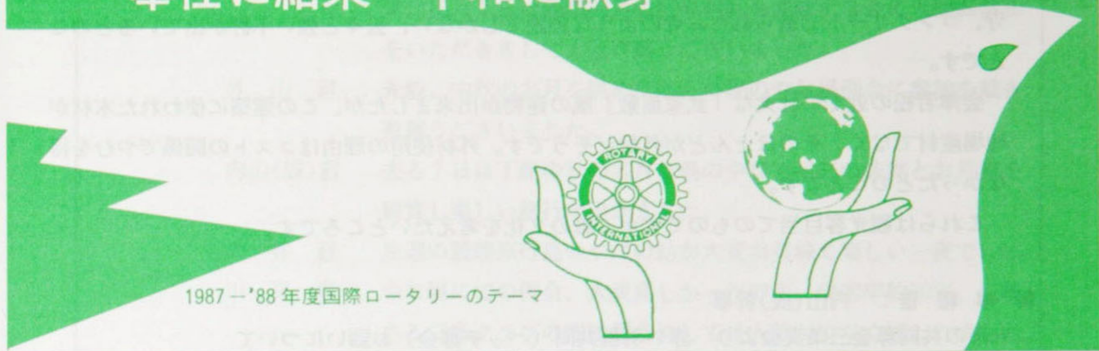
1987-'88年度国際ロータリーのテーマ

ROTARIANS—— UNITED IN SERVICE—DEDICATED TO PEACE