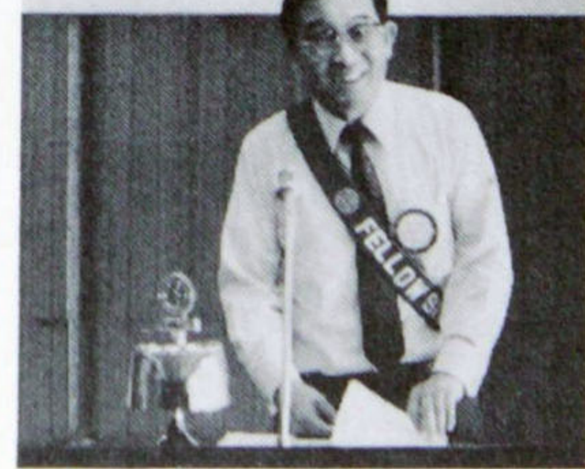
ANS-UNITED IN SERVICE-DEDICATED TO 国際ロータリー会長 チャールズC....