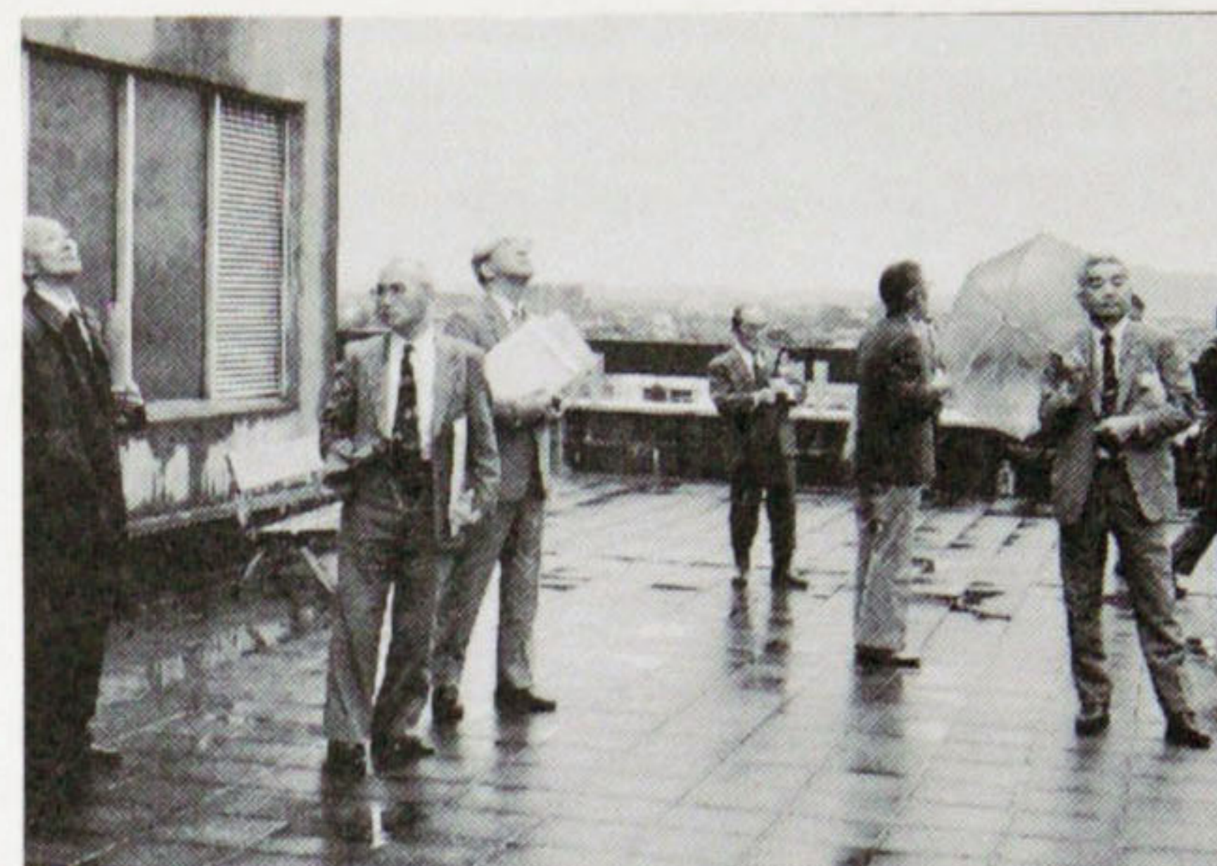
屋上で送受信のパラボラアンテナを見上げる