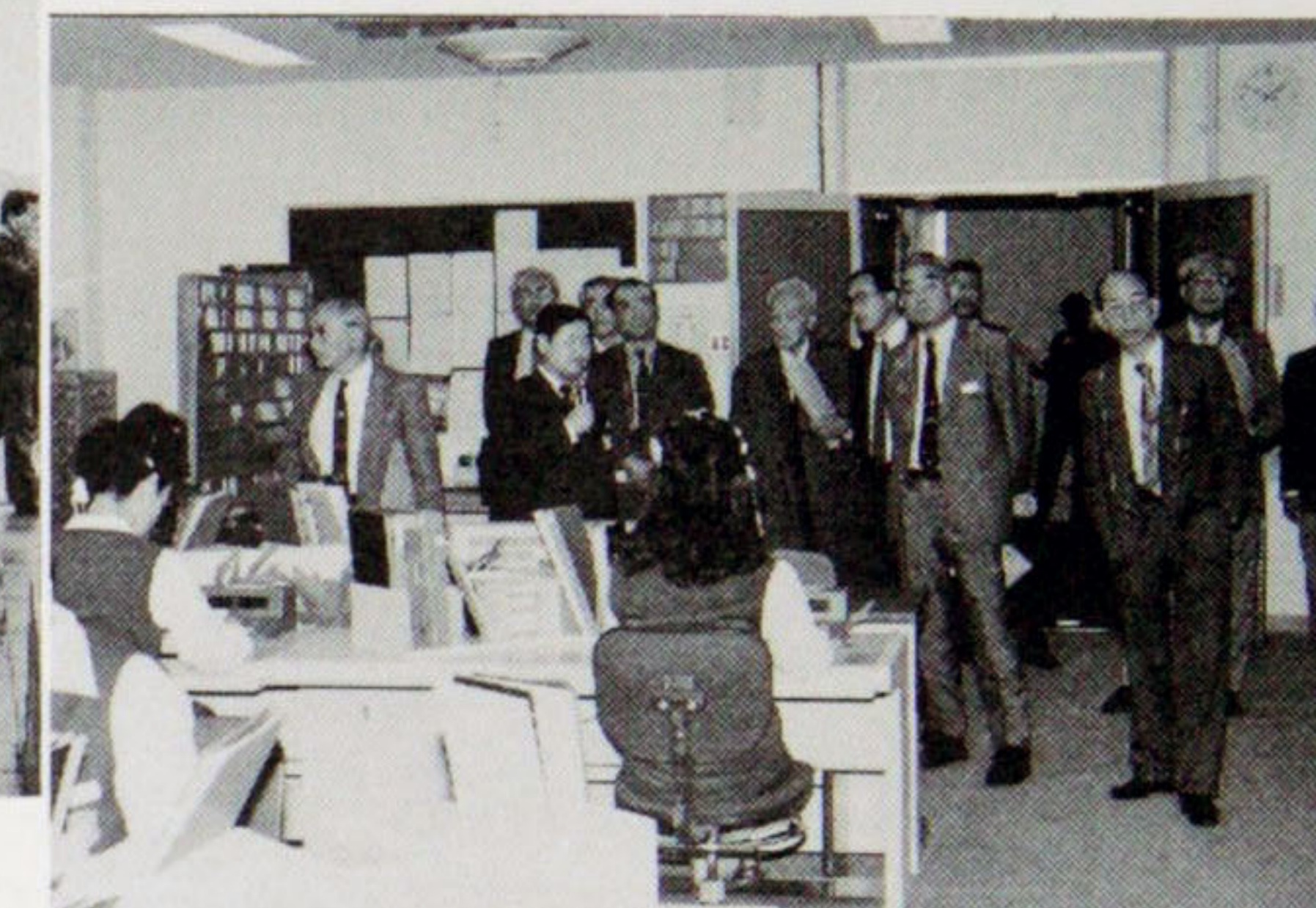
番号案内室で説明を聞く会員