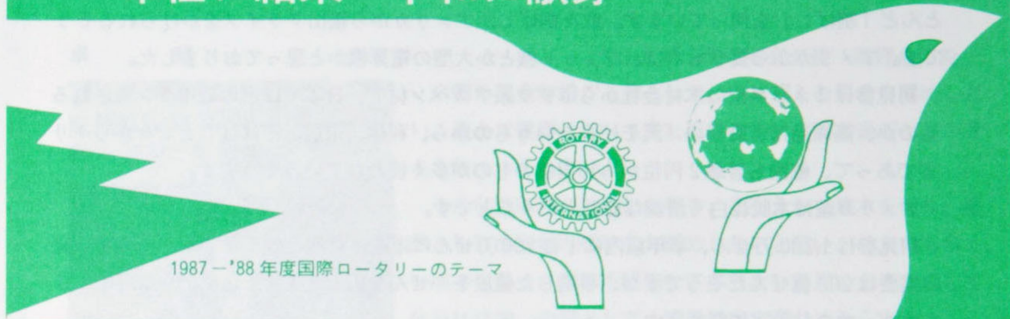
1987-'88年度国際ロータリーのテーマ

ROTARIANS—— UNITED IN SERVICE—DEDICATED TO PEACE