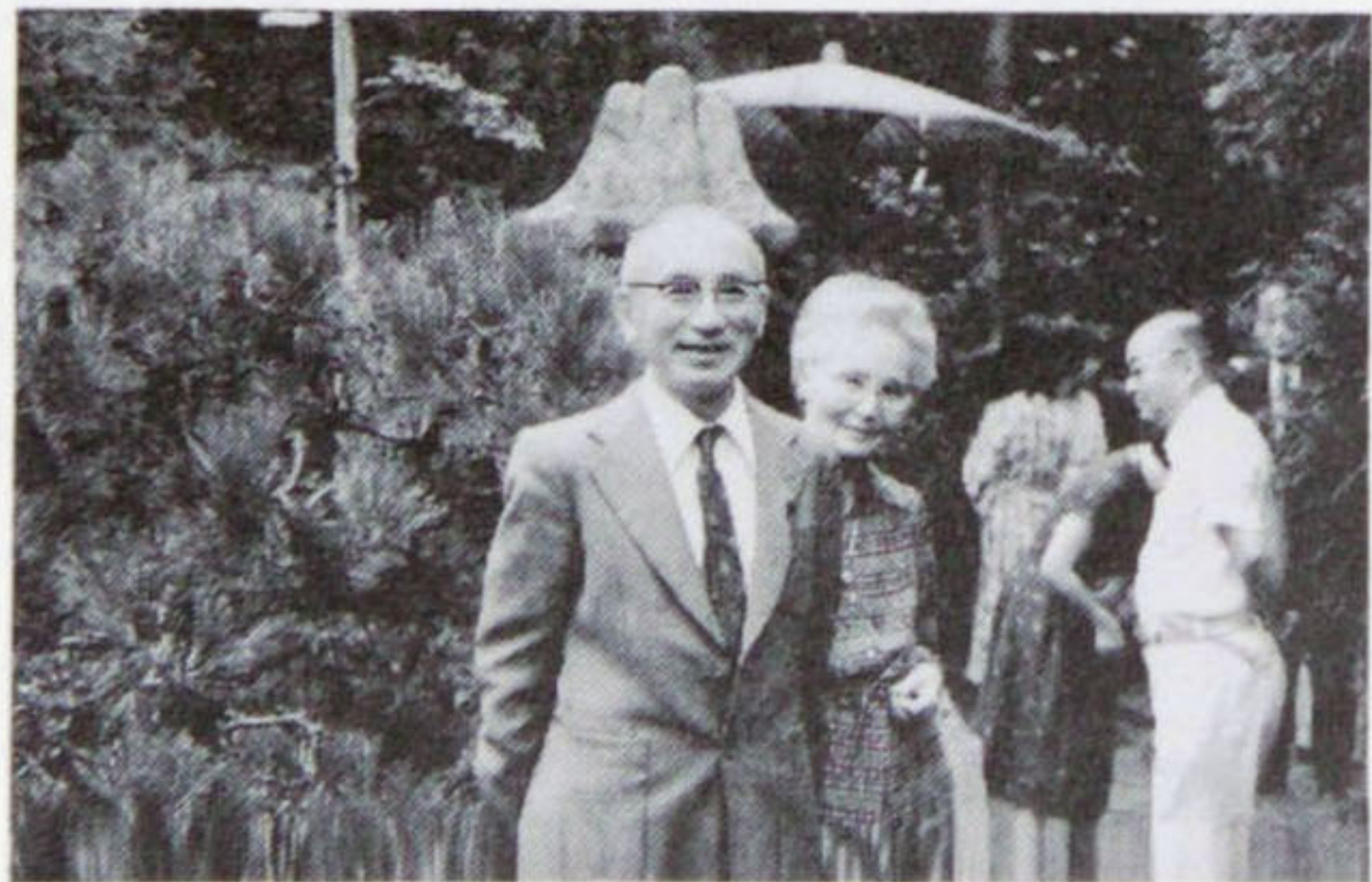
55年8月 行形亭のロータリー親睦会

2年前に金婚を祝った妻（75歳）は山内一豊の妻以来（意味わかるかな？）の妻です。養子夫婦と孫2人の6人が兔小屋で楽しく暮らしています。どこで会ってもヤーと声をかけて下さい。