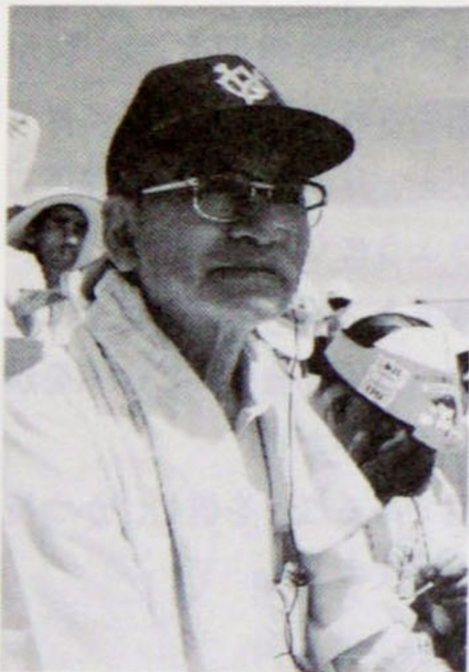
62年7月 巨人、中日観戦（新潟） （川上哲治氏に似てるというがほん とかな）

ロータリーとベースボールで充実した79歳の老人です。ロータリー歴30年は何よりもの財産です。