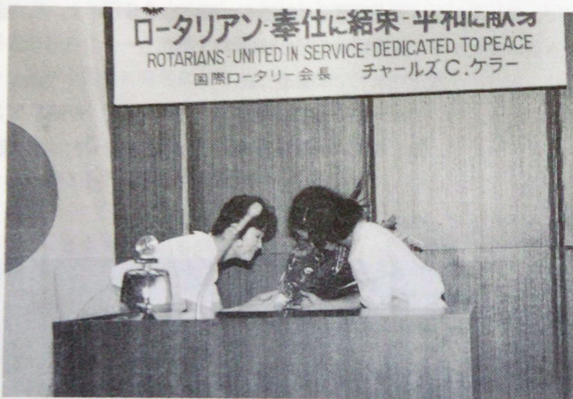
新・旧事務局員、花束贈呈でバトンタッチ