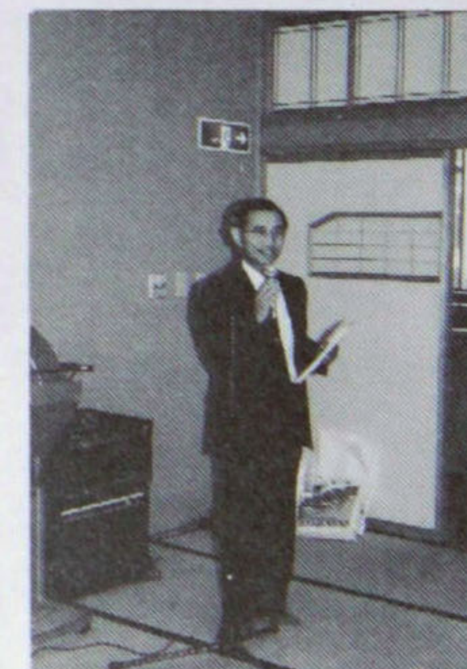
榎本親睦委員長の司会