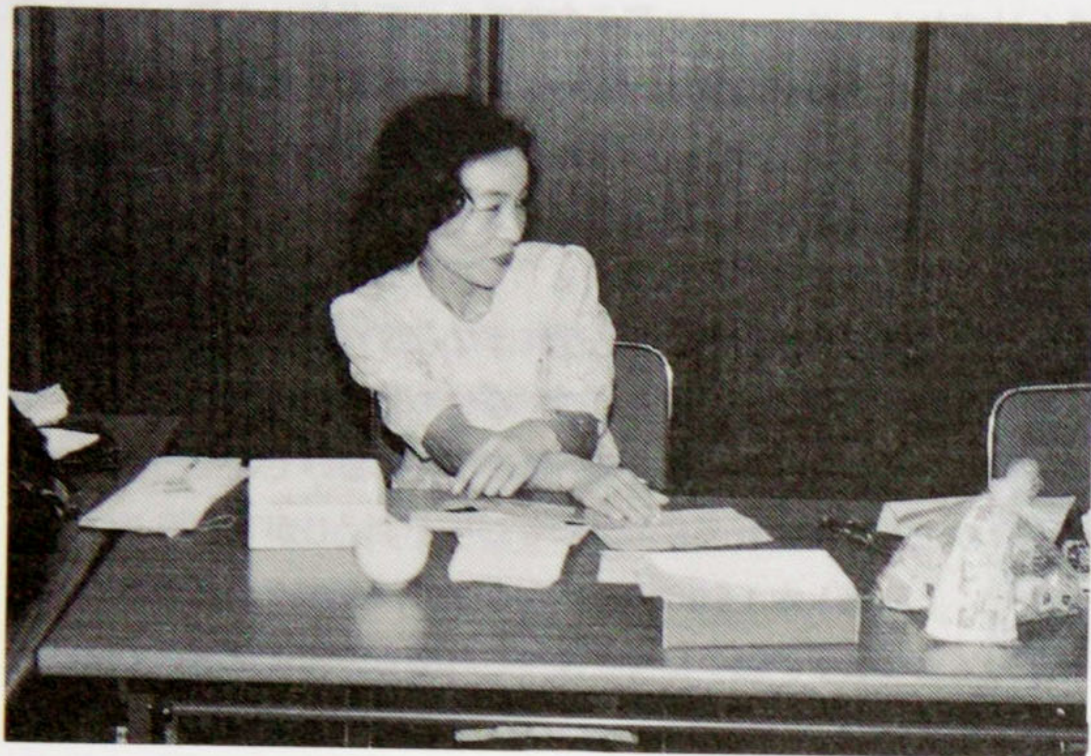
白椿さん、おさめの例会ごくろうさまでした！