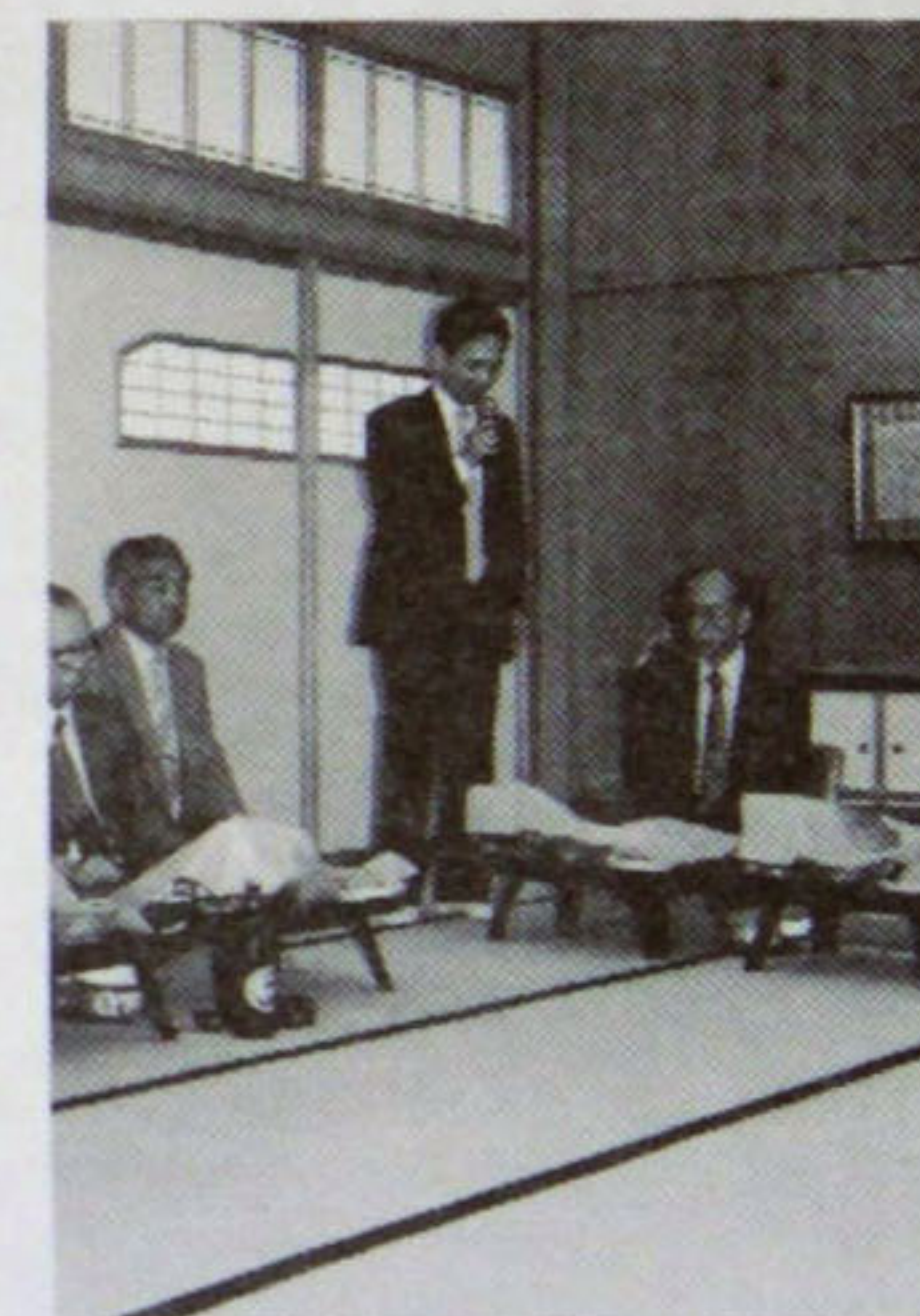
三条クラブ熊倉会長挨拶