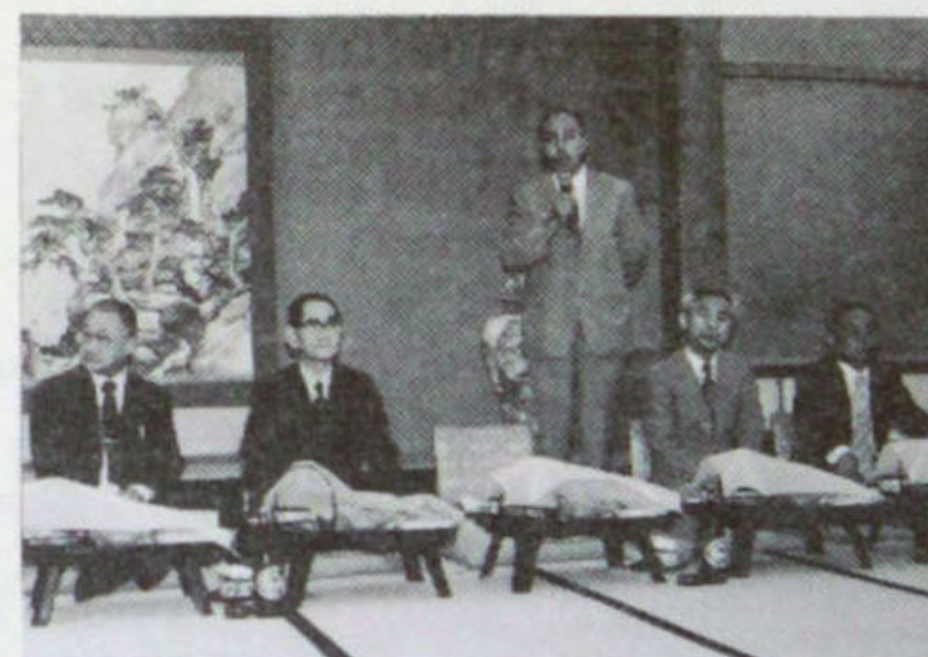
三条北クラブ金占会長挨拶