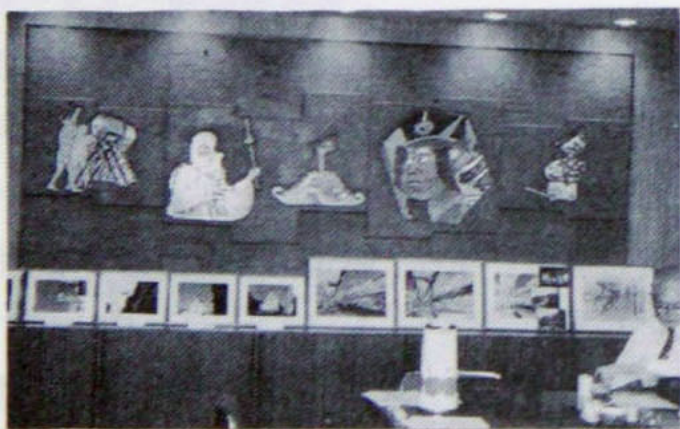
ドイツローテンブルグの街並みのミニ写真展

三条ドイツ村は生活者も、観光客も来て楽しめる商業遊園地を街のあちこちに遊び心をもった建物と広場、公園などをつくりたいと思っております。そうすれば建物も商品になるのではないかと思います。商店街全体で建築協定を結び屋根の壁の色、統一看板など街並みの美観に寄与出来るようにしたいと考えております。いずれにせよ商店街活性化をおしすすめようという人を増していくしかないのでありまして、一ノ木戸を愛する人が集まってこのような計画が出来上っていくのであります。商店街の皆んなが幸せになりたいと思う心を最終目標にしながら、三条ドイツ村をつくっていききたいと思っております。そして三条の皆さんから喜んでいただける街づくりをしていききたいと思っております。