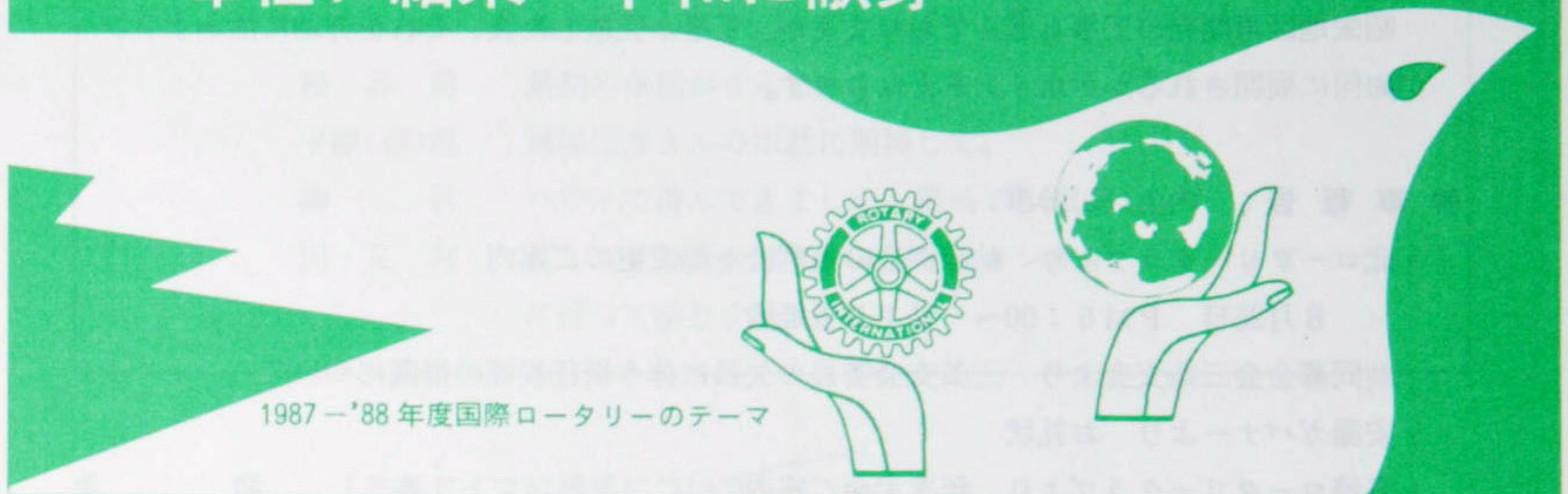
1987-'88年度国際ロータリーのテーマ

ROTARIANS—— UNITED IN SERVICE—DEDICATED TO PEACE