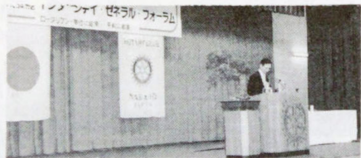
全体会議で第四分区を代表して熊倉会長実行計画を表明