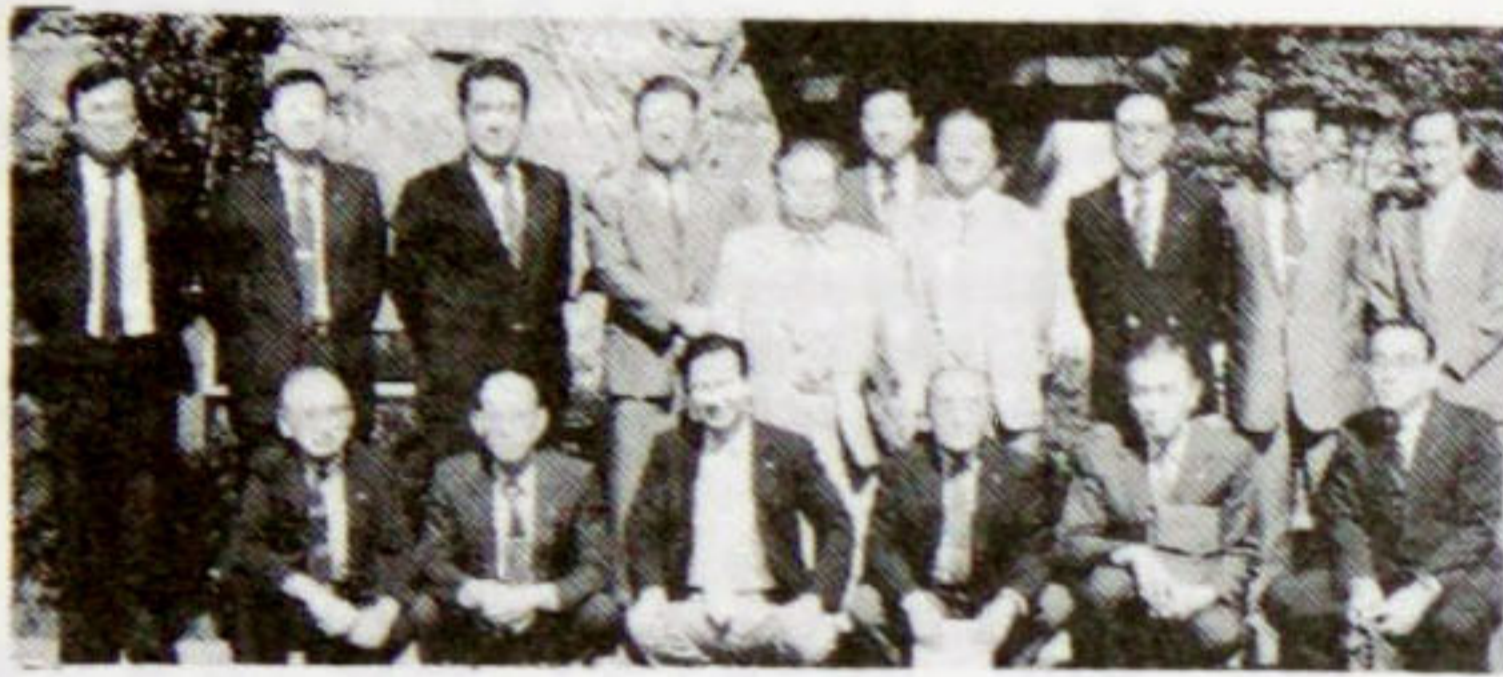
会場の胎内パークホテルで出席者ハイポーズ