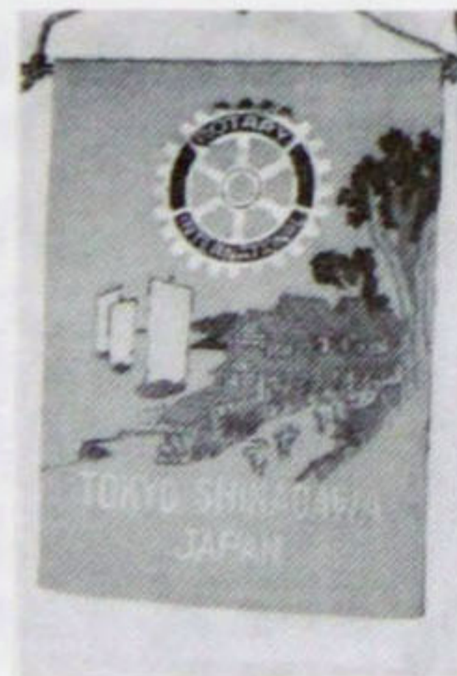
第258地区 東京都 東京品川ロータリークラブ