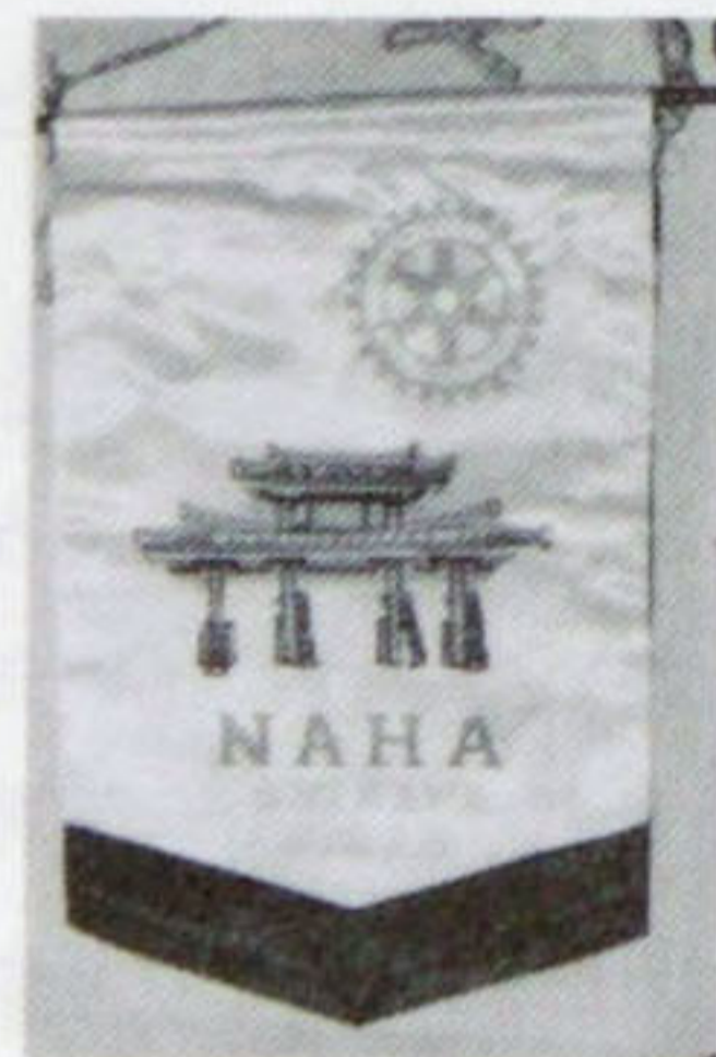
第258地区 沖縄県 那覇ロータリークラブ