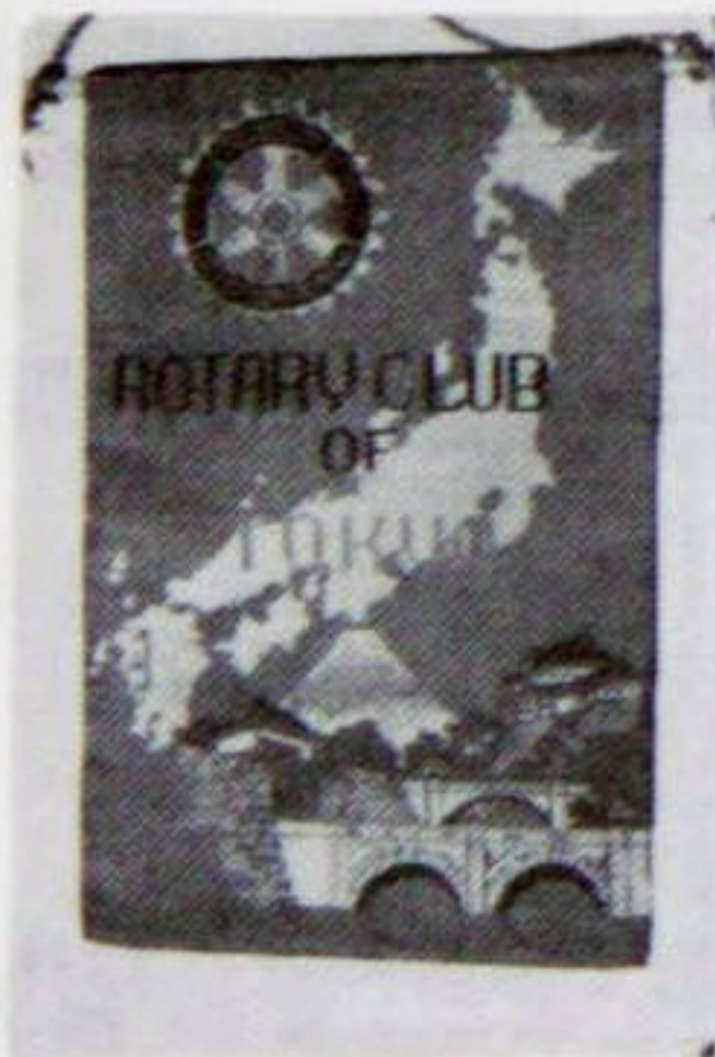
第258地区 東京都 東京ロータリークラブ

会員の皆様が各地にメーキャップされ、そこで交換なされたバーナがたくさんございます。週報の有効利用を考え掲載してみました。