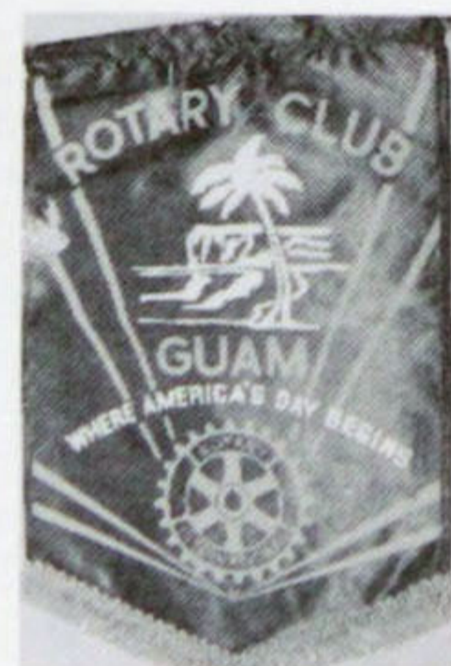
第275地区 グアム島 グアムロータリークラブ