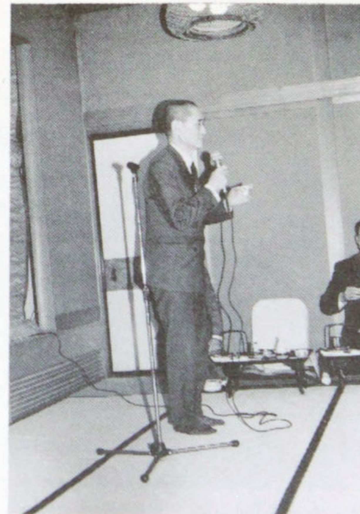
藤田説量直前ガバナーの乾杯で開会