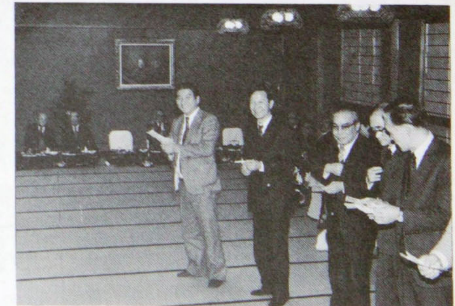
ゲームの結果はハズレ賞でニコニコボックスへ