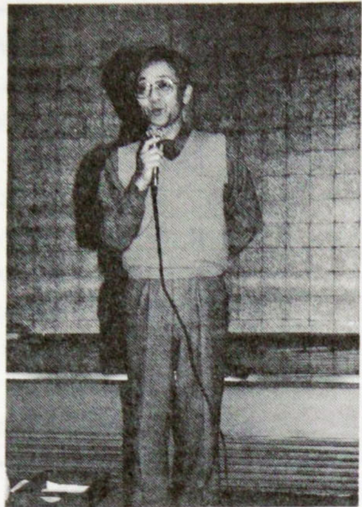
日戸直前会長の久し振りの万歳の前の 挨拶で中じめ