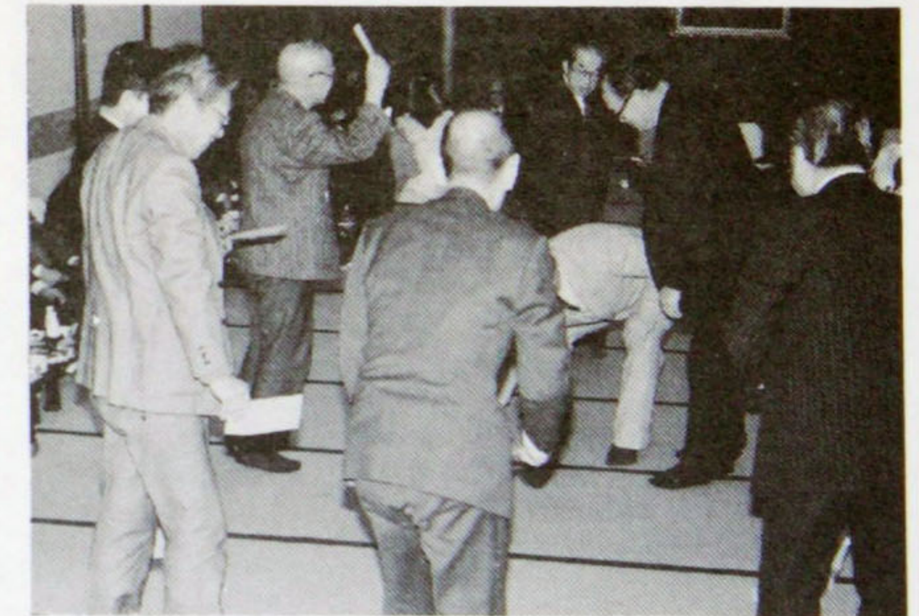
まずはゲームでハッスル