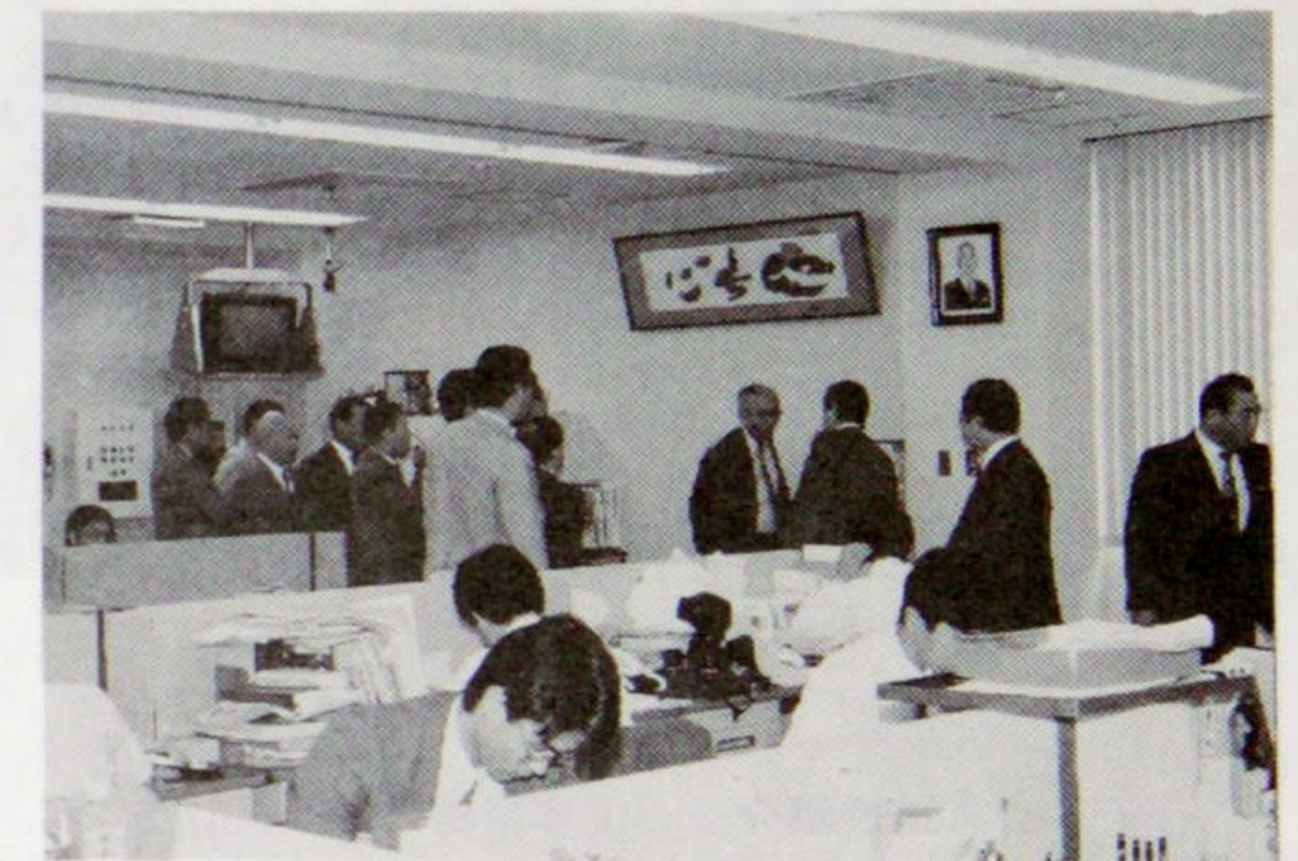
営業部室で説明を聞く会員