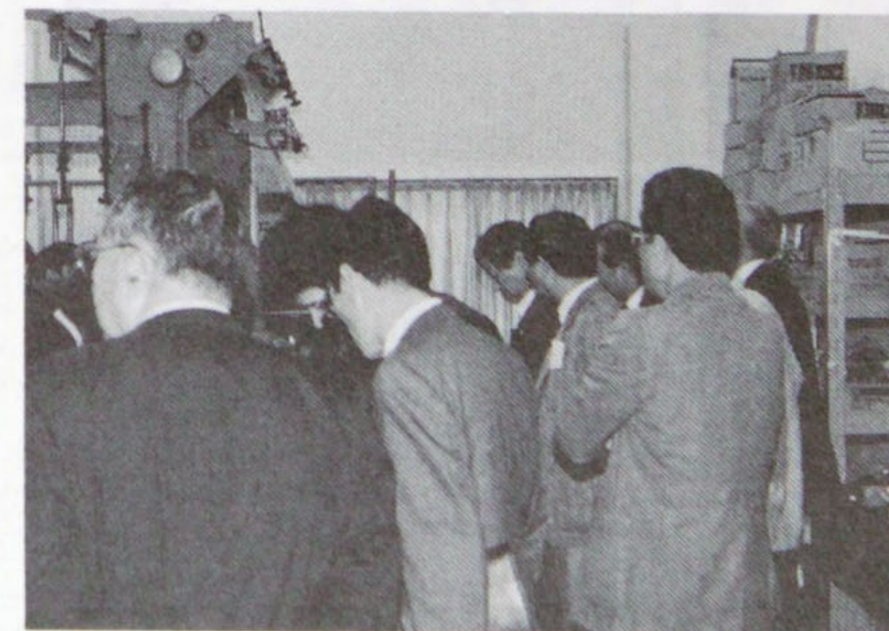
高速輪転機のすごさに感心