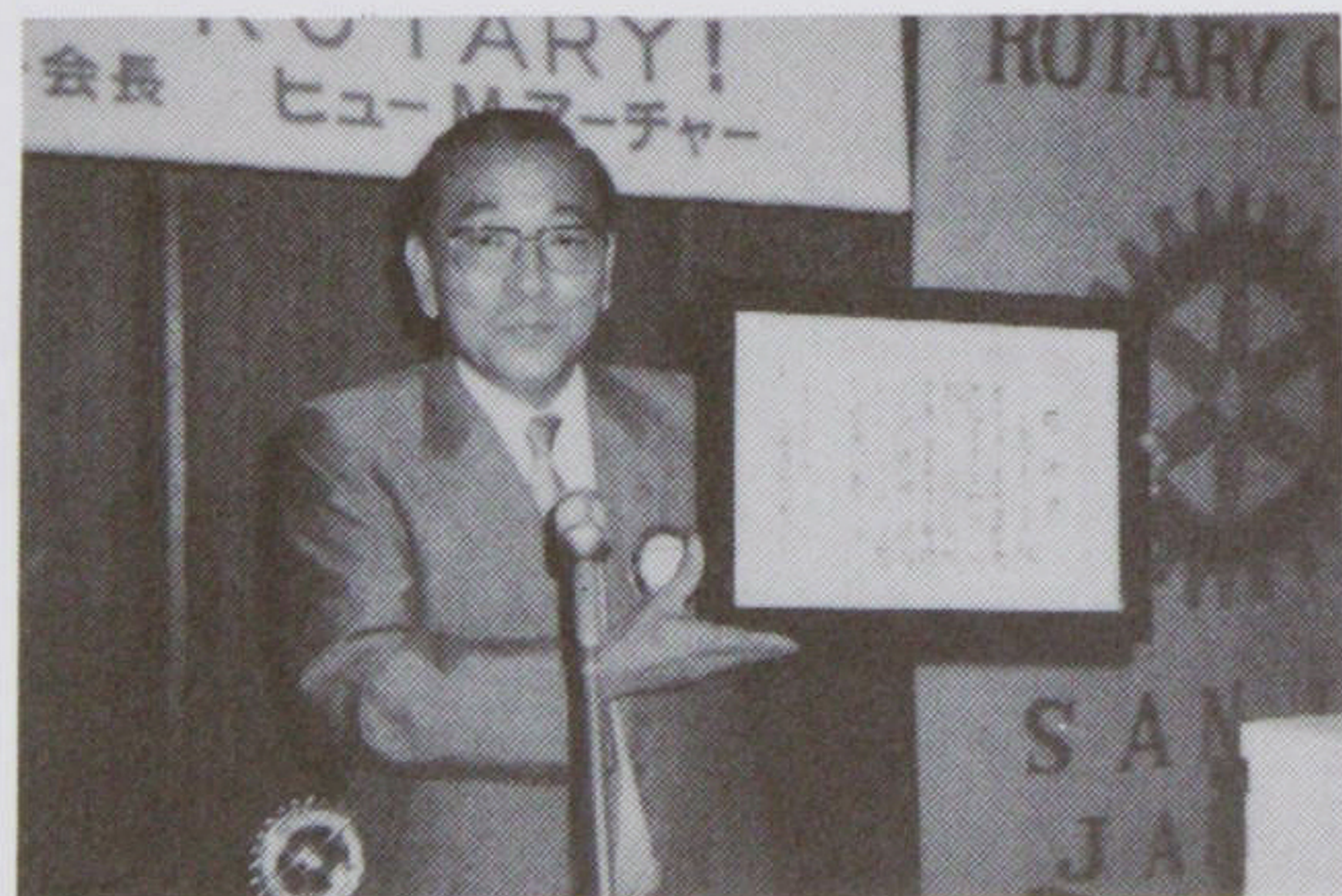
三条市教育委員会より 郷土資料館寄付につき感謝状

義務出席者 会長、幹事、クラブ奉仕、会員増強、出席、プログラム、職業分類、職業奉仕、社会奉仕、ローターアクト、高齢者問題、青少年奉仕、国際奉仕、ロータリー財団の各委員長、新入会員(1988年9月1日以降入会の新入会員(9名))以上23名