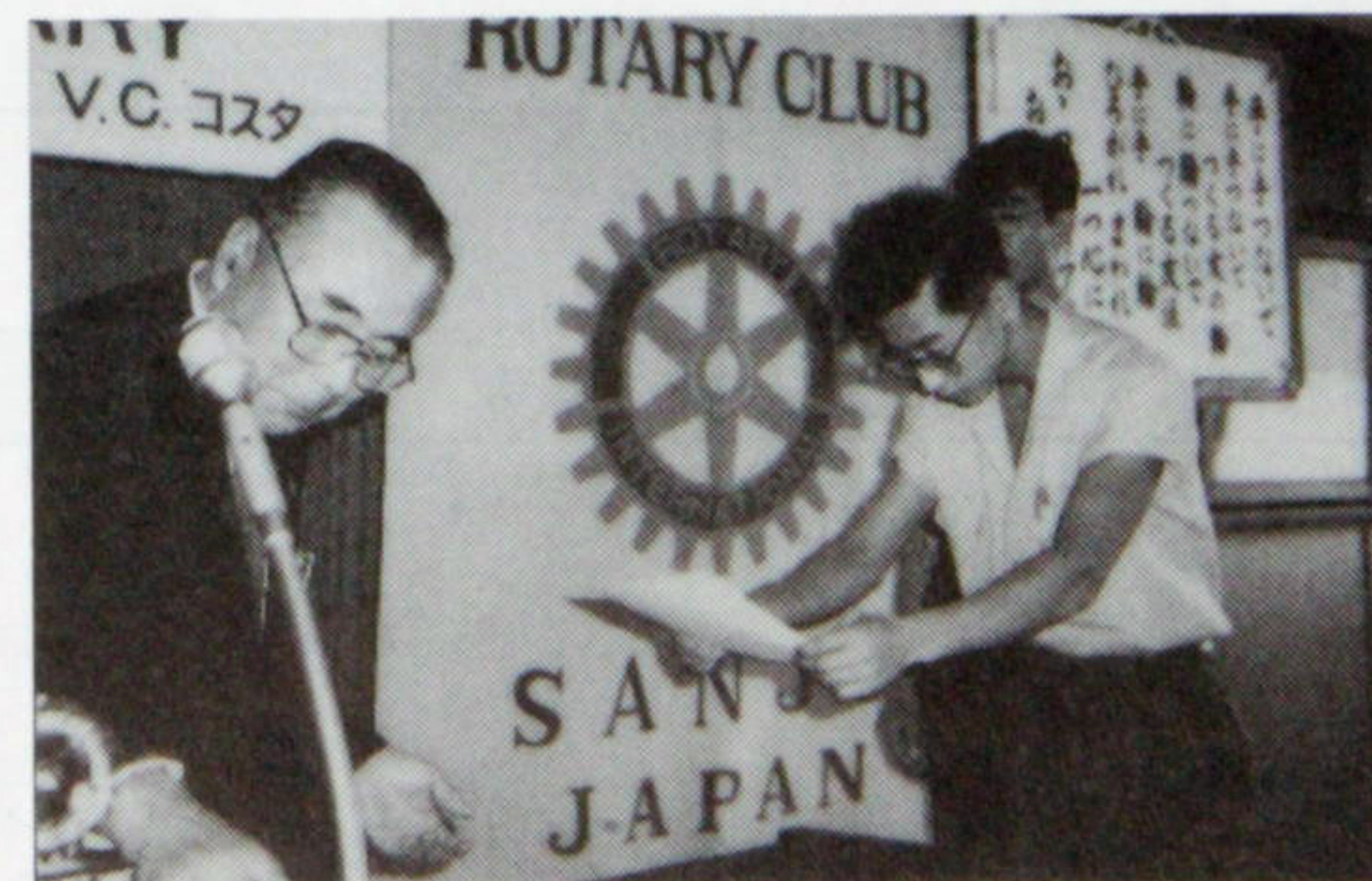
ライラ研修 終了証書の授与