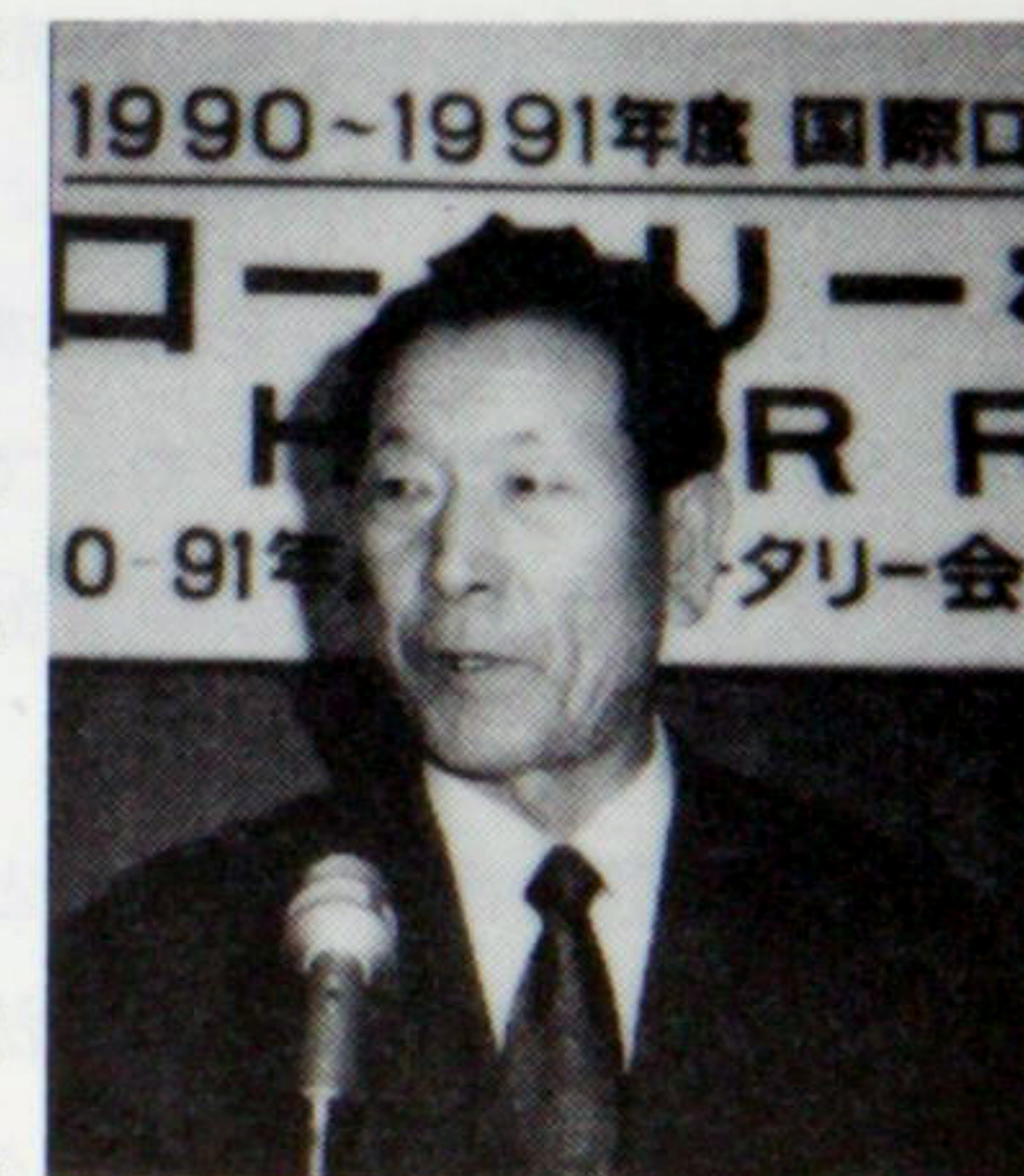
1990~1991年度 国際ロータリー会

この蓬来作りは仲々手間と年数のかかるもので出荷するまでは松の実を蒔いてからは少なくとも6~7年位かかる。昔はお盆過ぎから9月いっぱい位山の畑に登って松作りをし