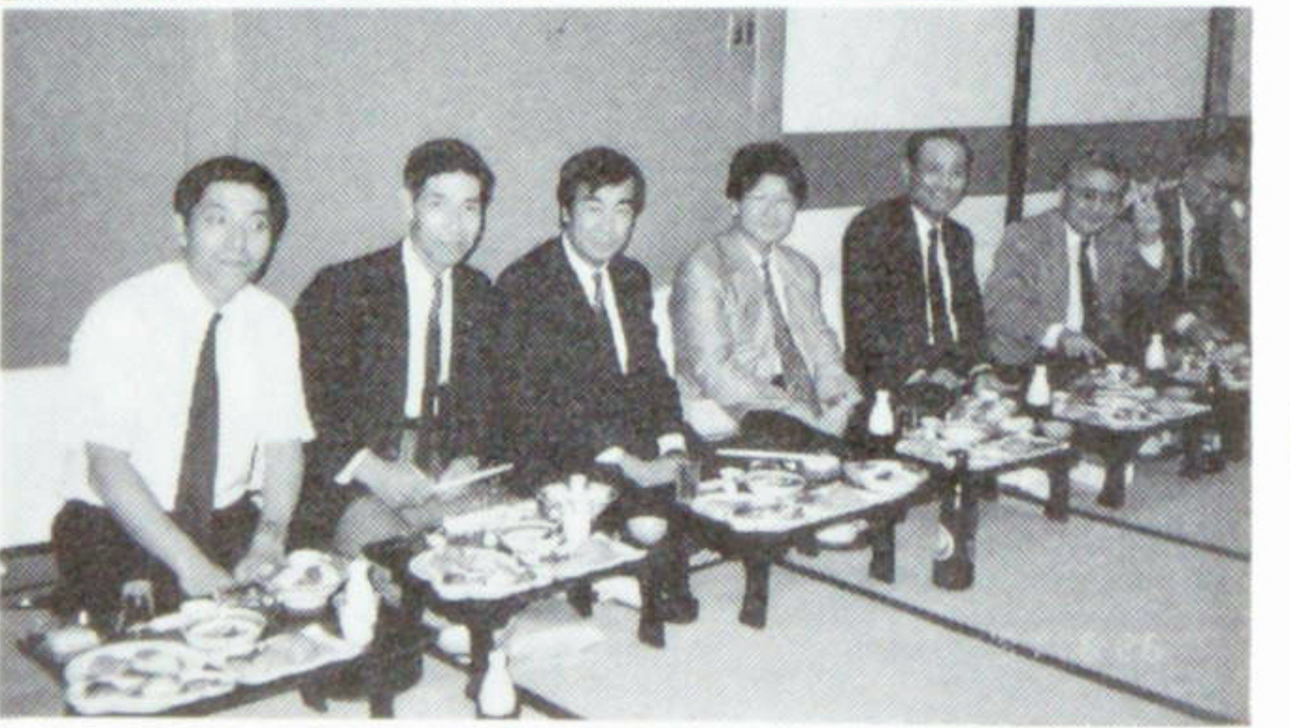
7月3日例会 クラブアッセンブリー