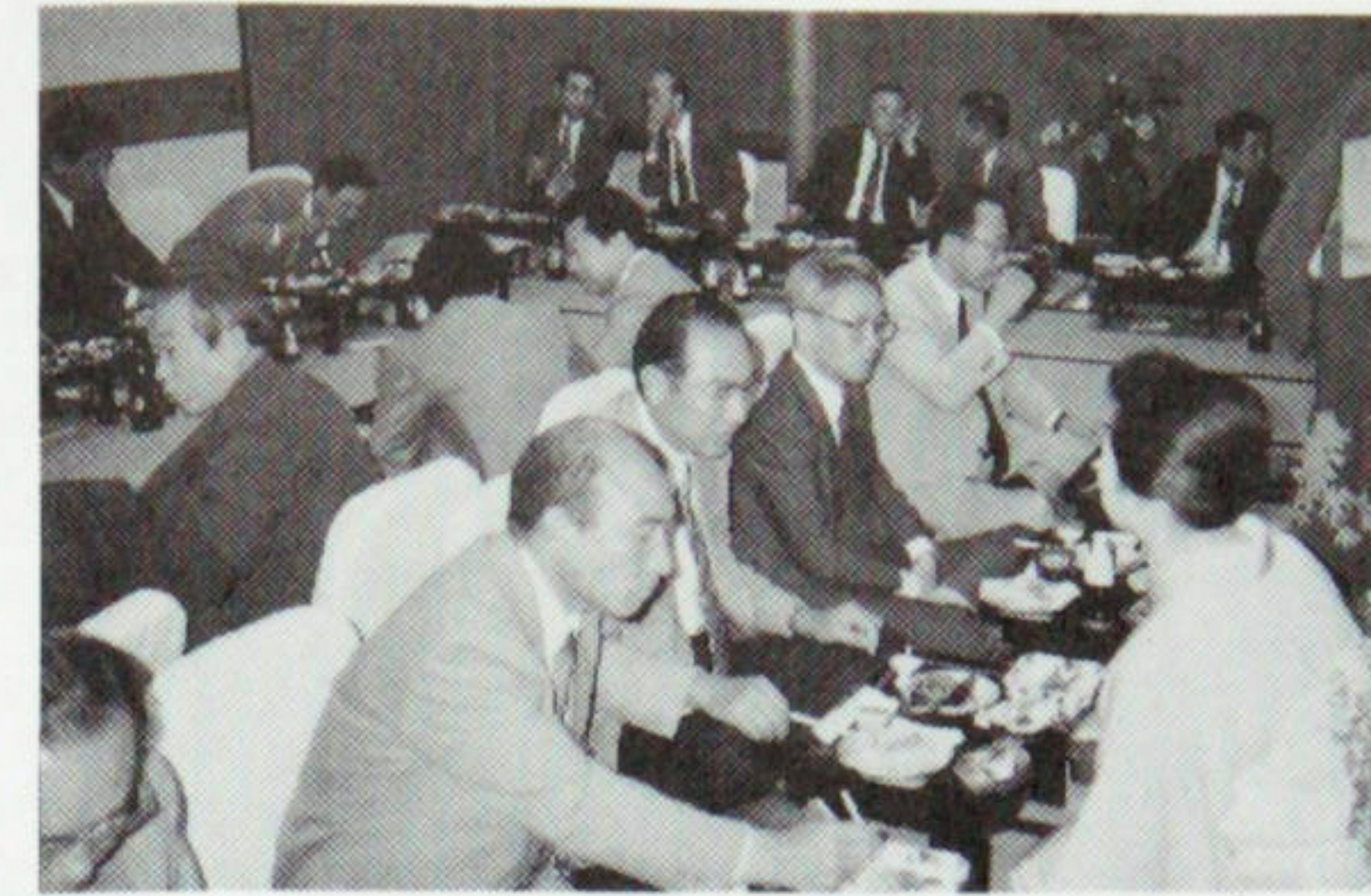
歴代会長、幹事さんは昔を思い出して