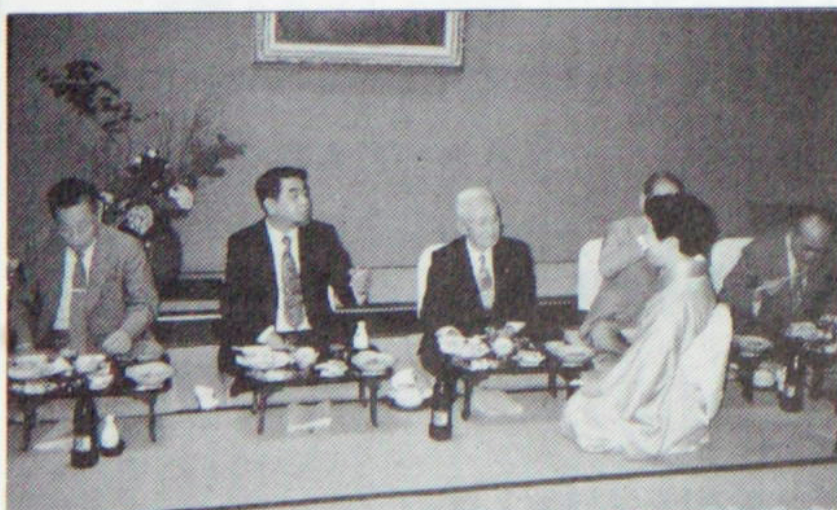
歴代会長、幹事さんは昔を思い出して