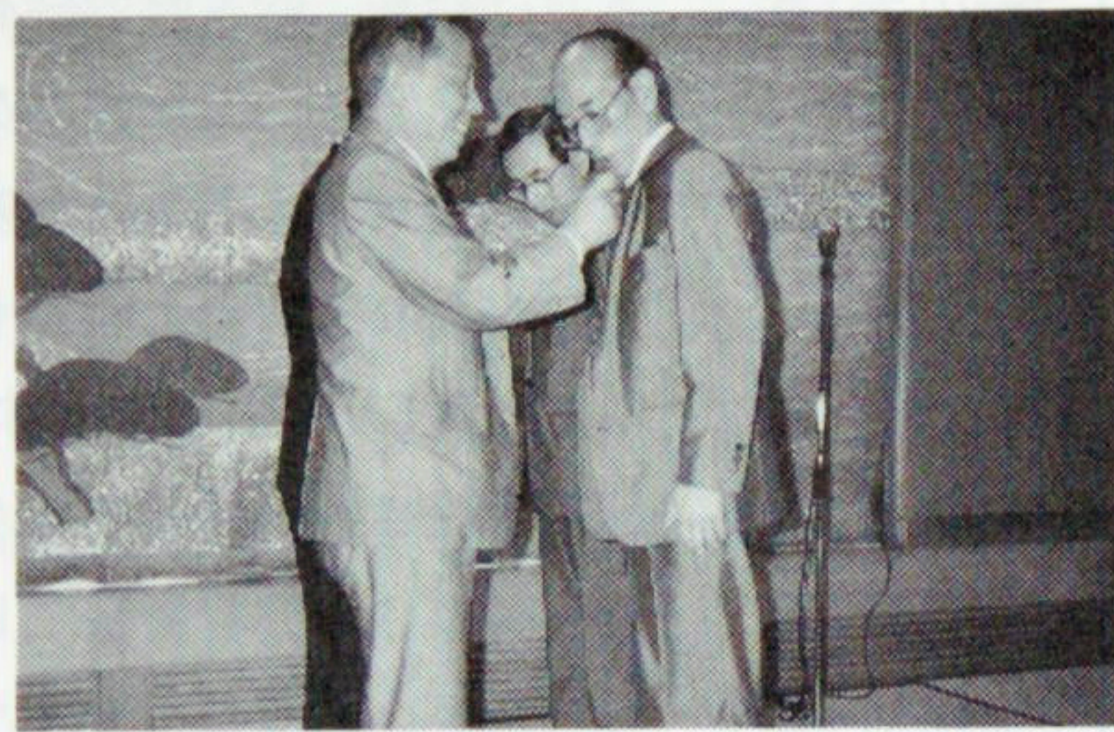
新旧会長、幹事のバッジ交換