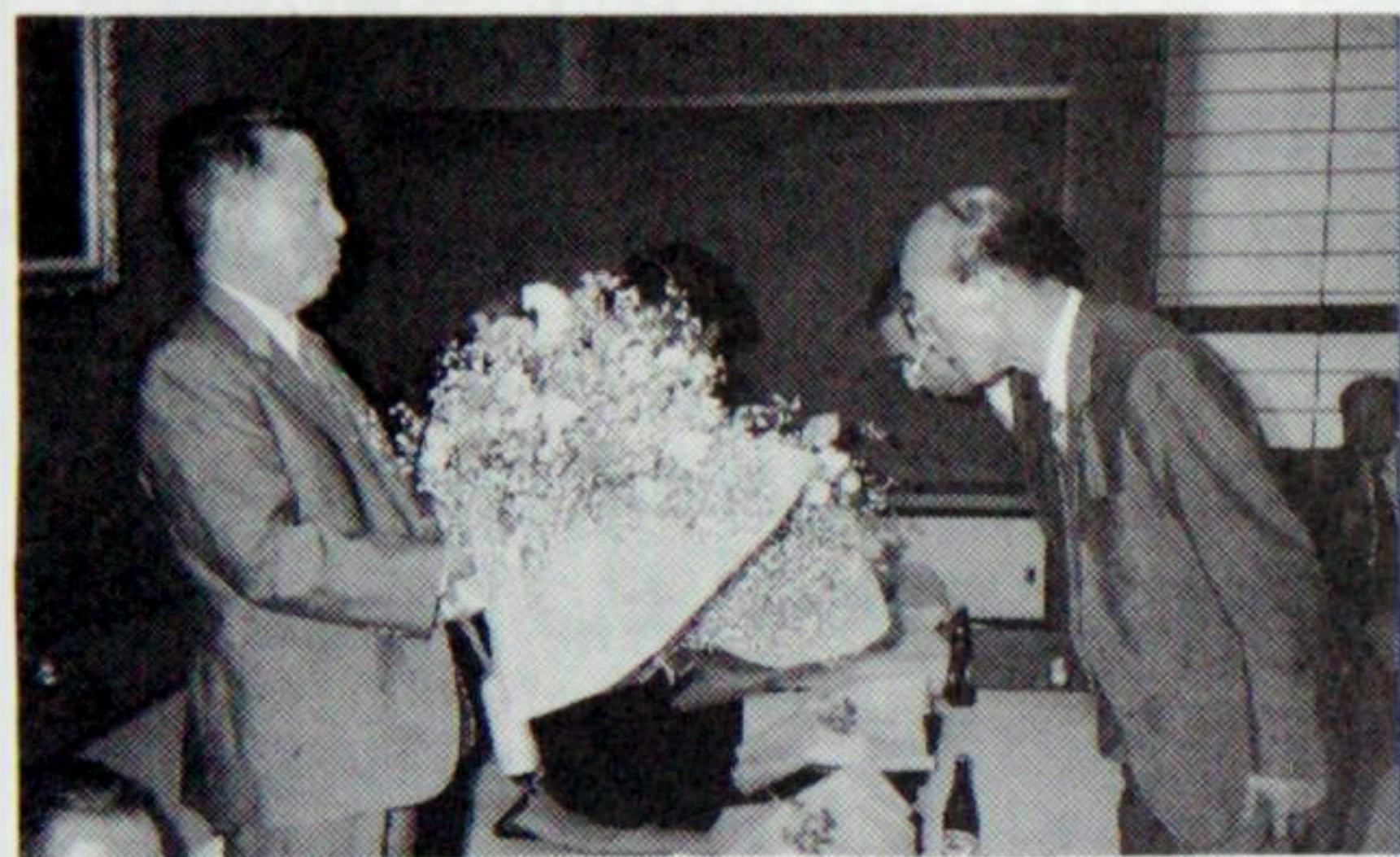
新旧会長、幹事の花束贈呈