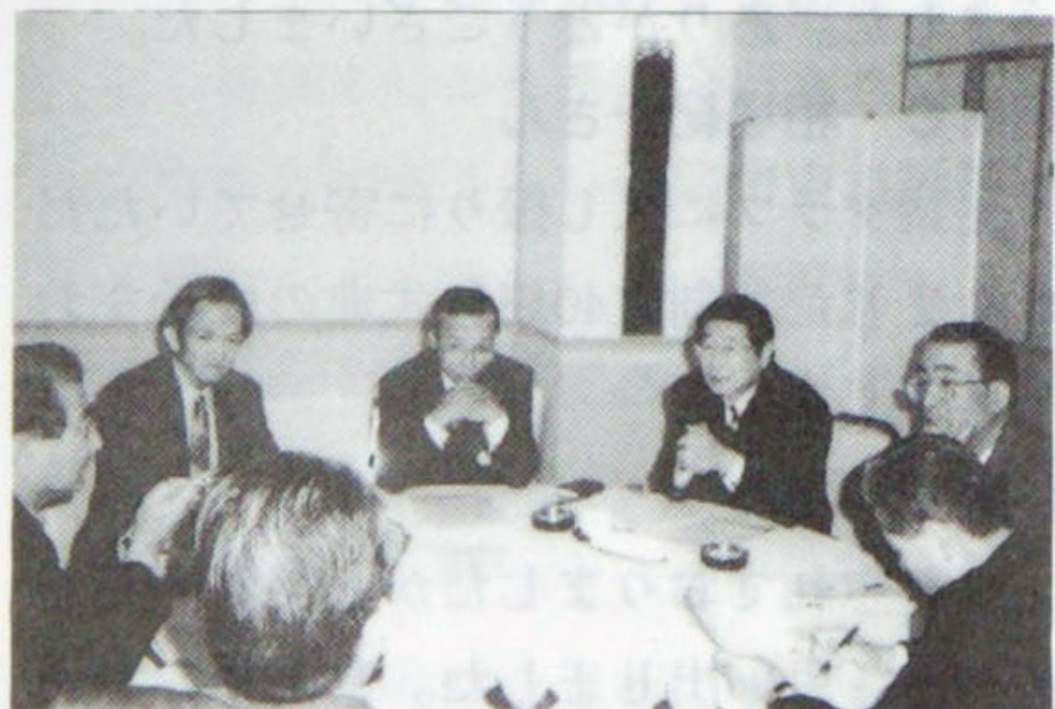
登録・受付委員会