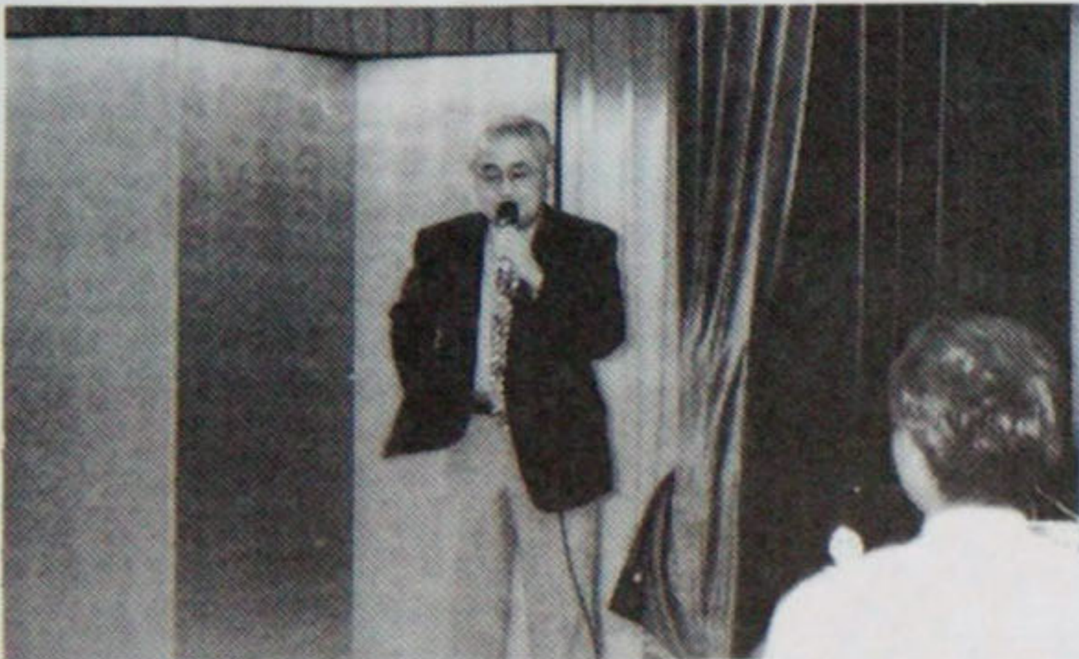
細井エレクトの万歳の発声