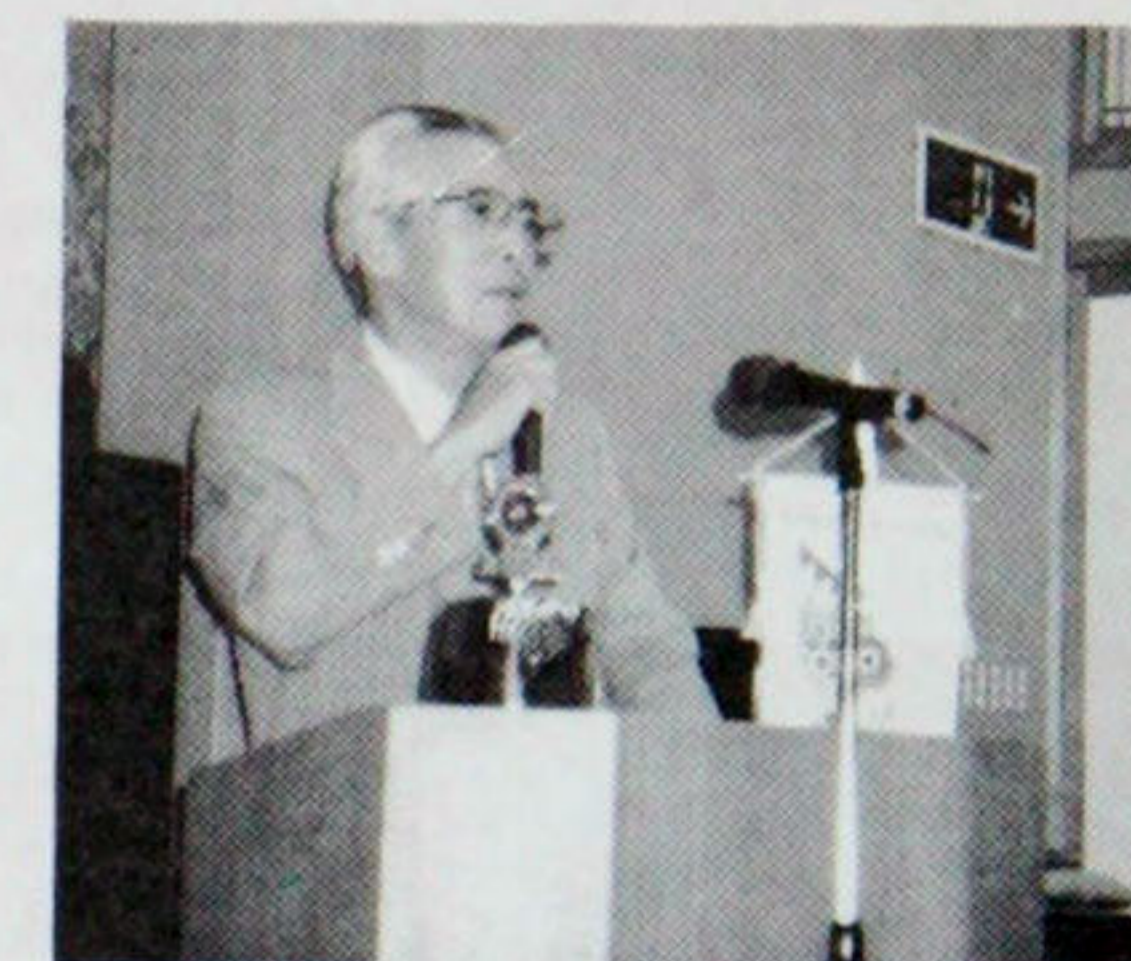
野水会員の乾杯の発声