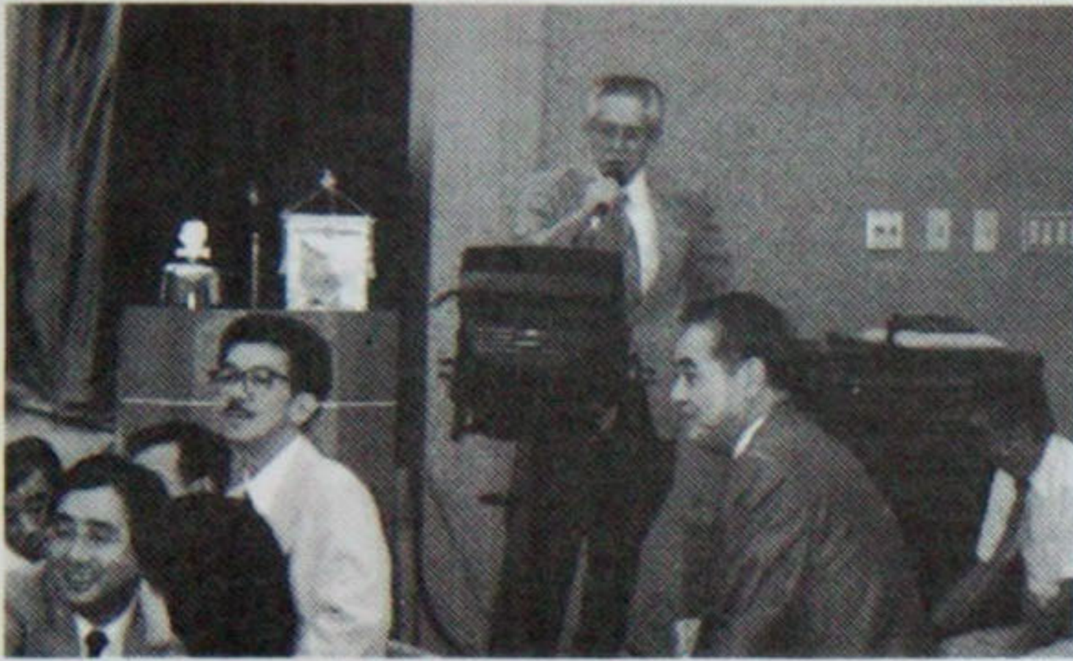
チャーターメンバー野水会員のこころ一番