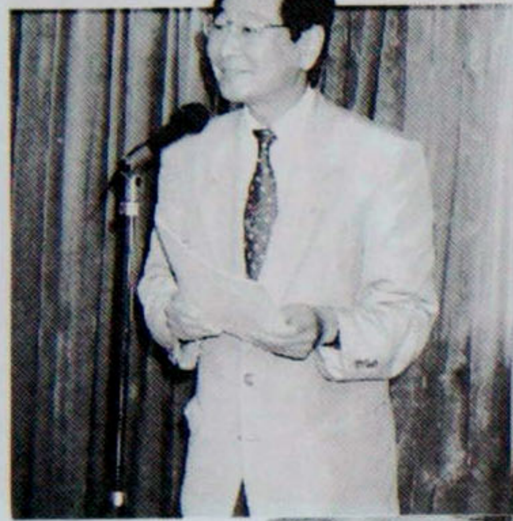
リベラ・ネーザンの 三条ロータリークラブ青少年