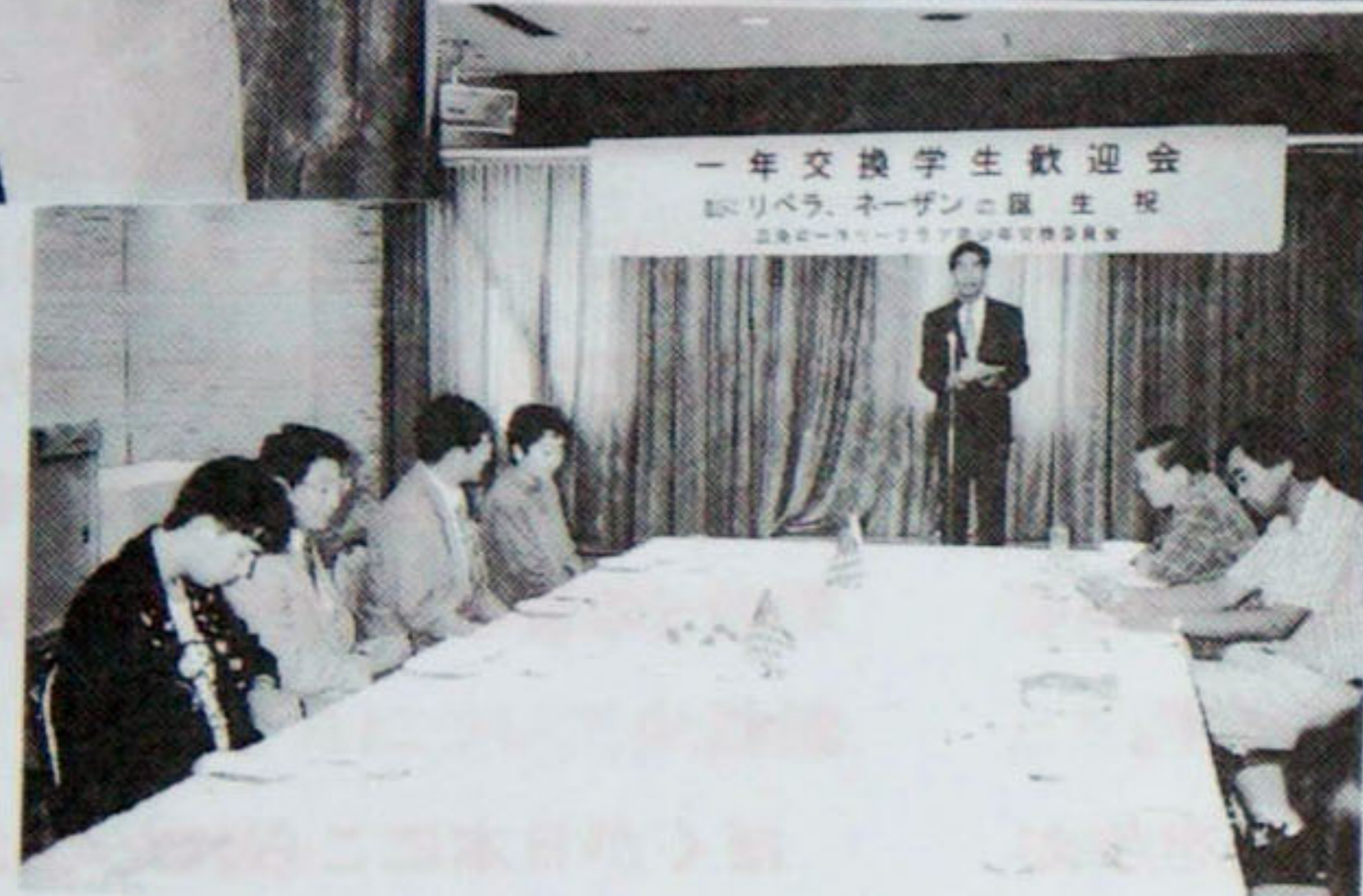
一年交換学生歓迎会 の誕生祝 青少年交換委員会