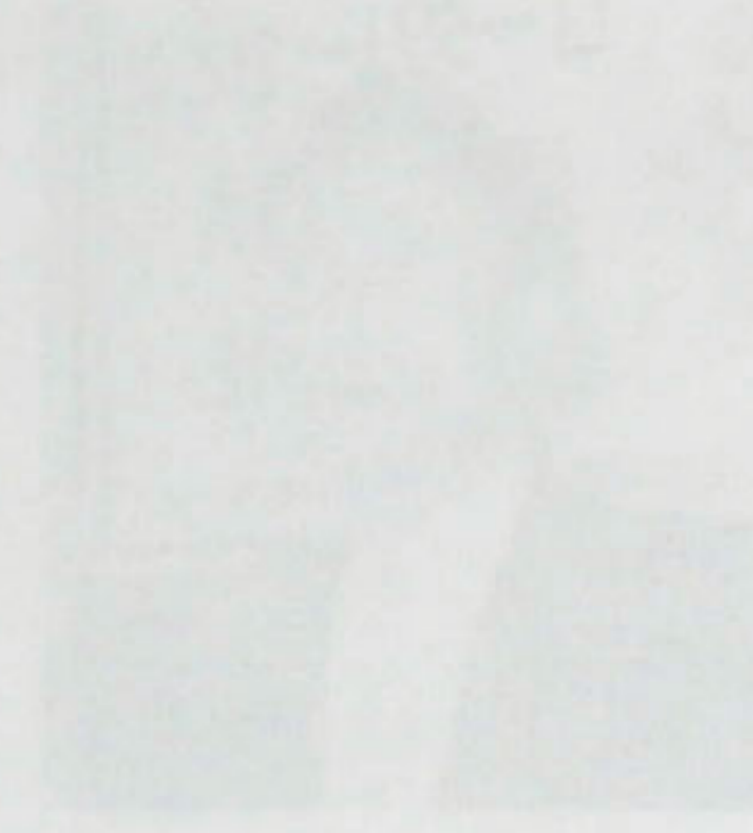
加東ローマリーニャの会務録M1... 加東ローマリーニャの会務録M1... 加東ローマリーニャの会務録M1...