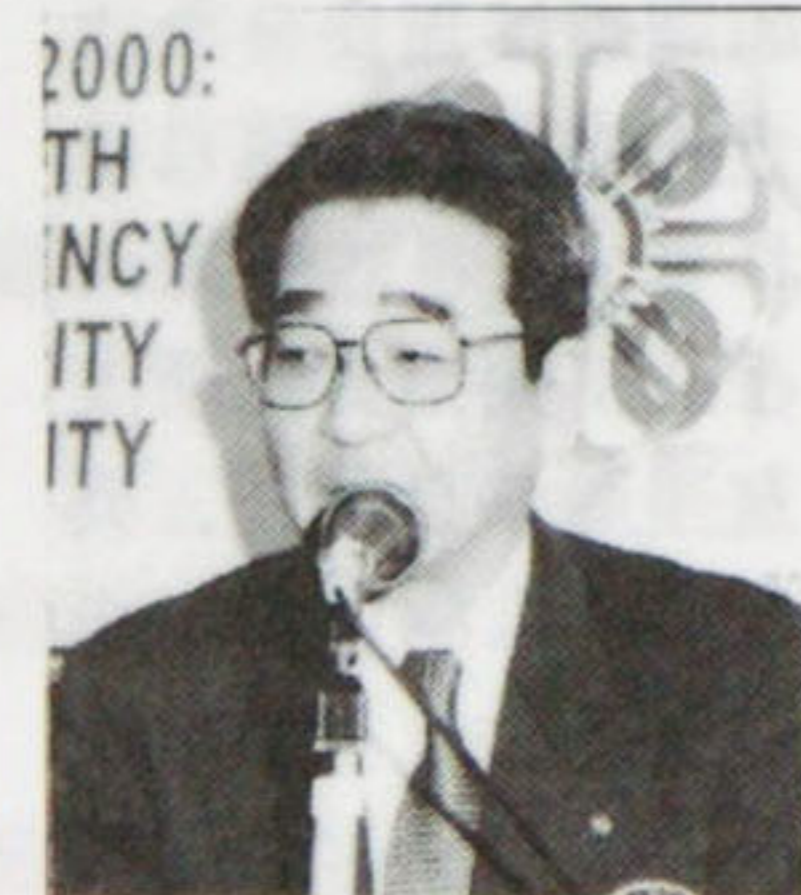
2000: TH NCY ITY ITY

東北電力の川瀬でございます。まだ内示の段階ですが、3月より新潟へ行くことになりました。行き先は、賛成、反対の原電立地の巻をやれと言われました。