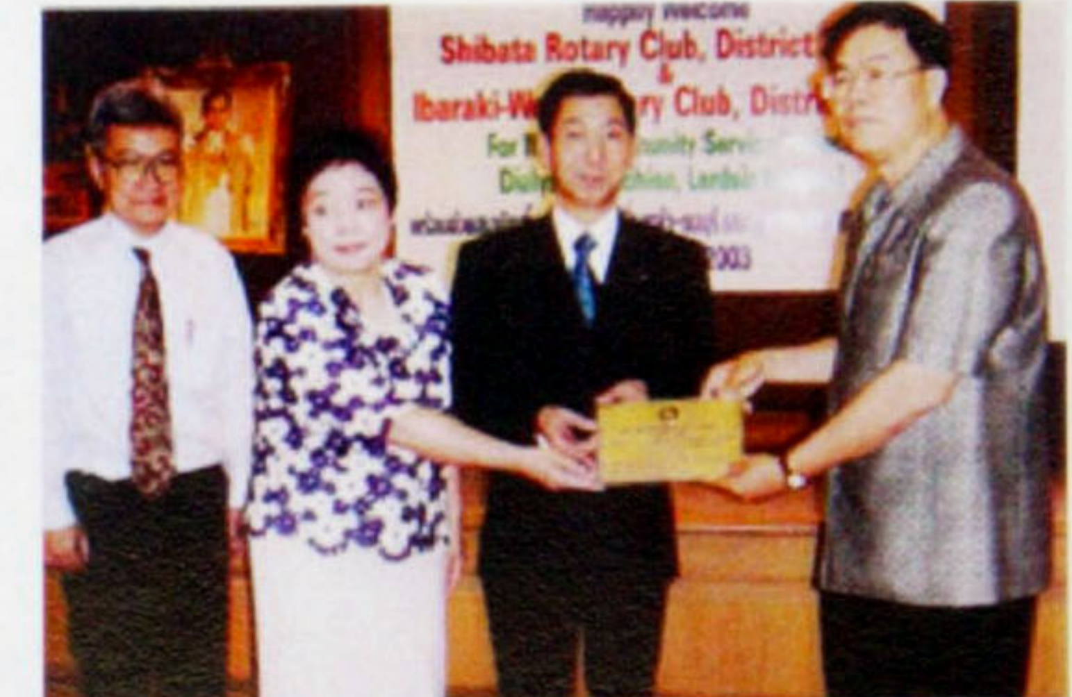
贈呈式 ラーシン国立病院にて