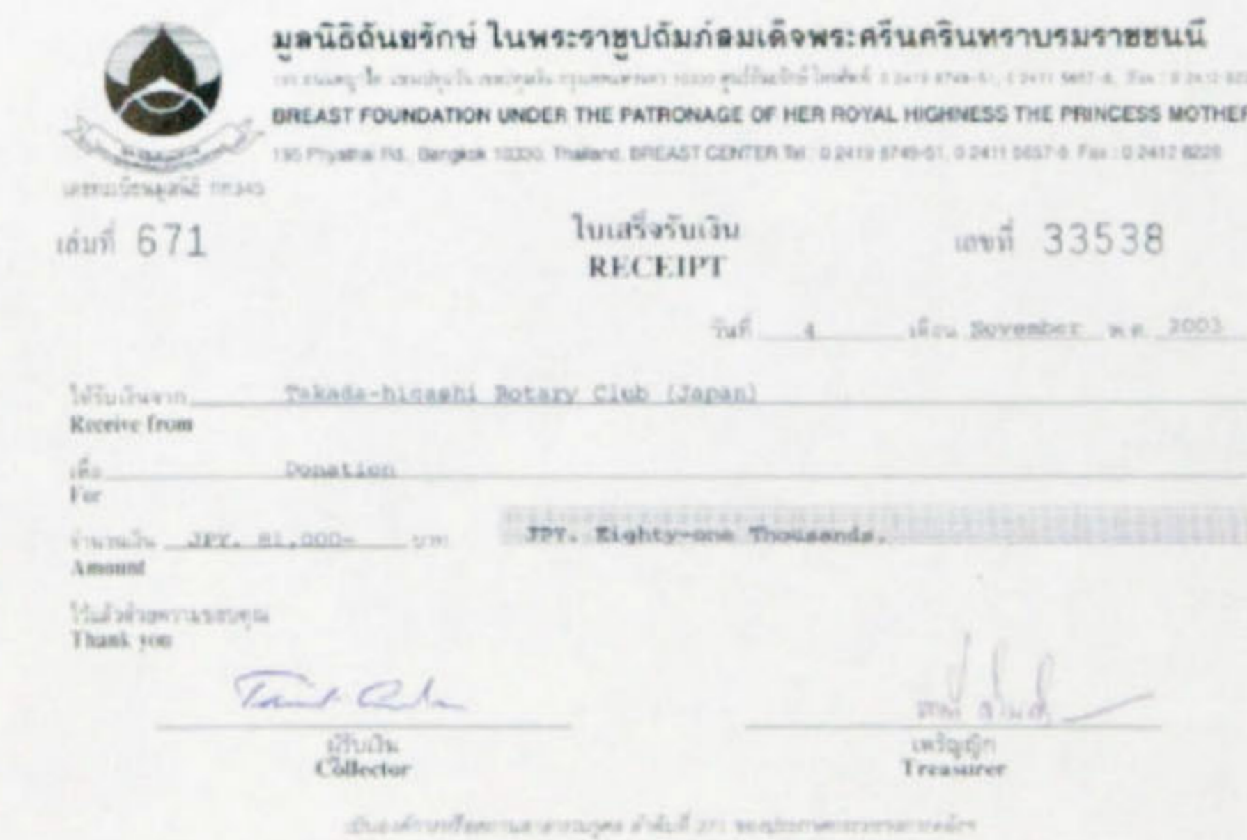
各ロータリークラブ宛の領収書