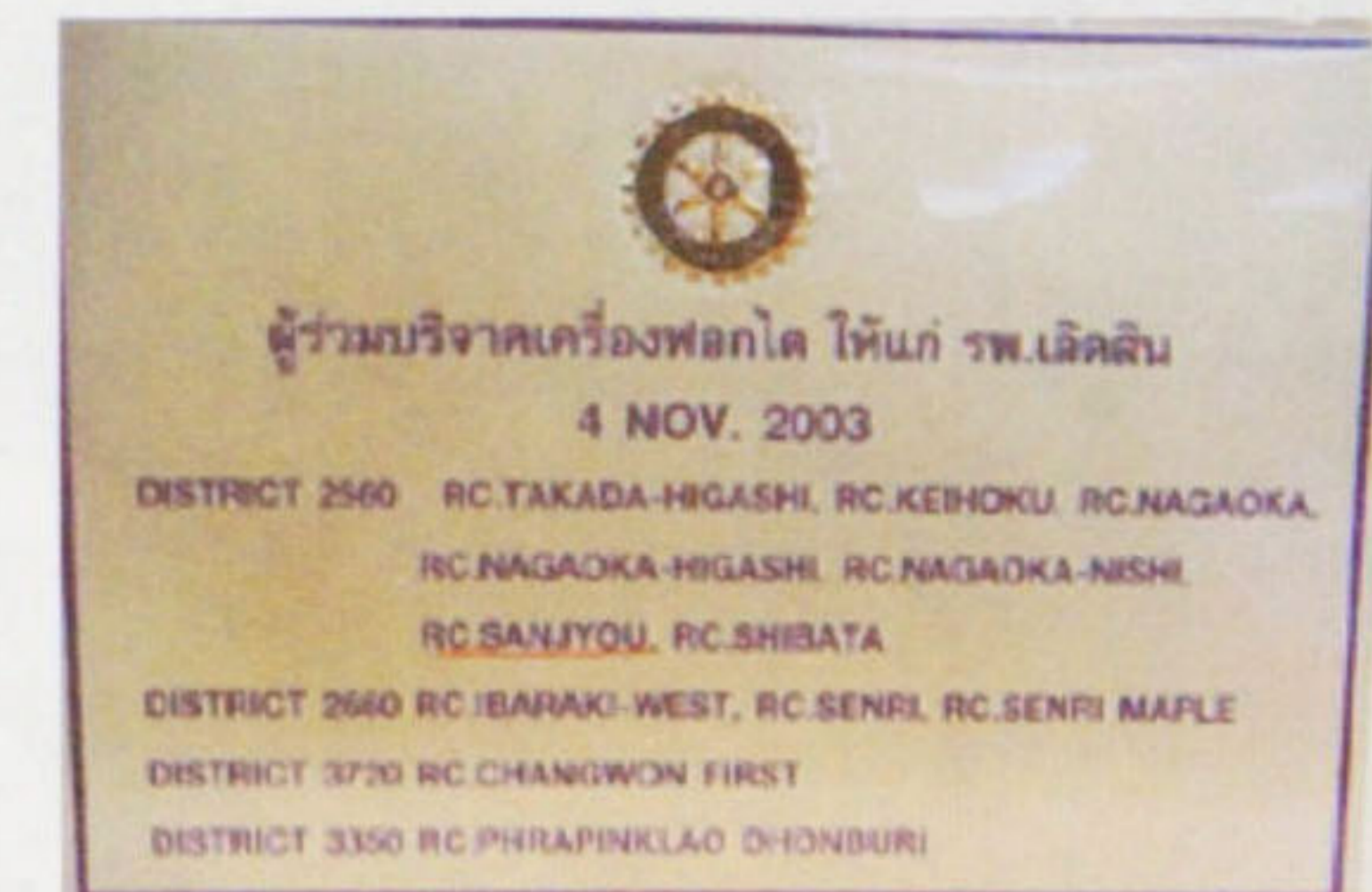
腎臓透析機についてのプレート