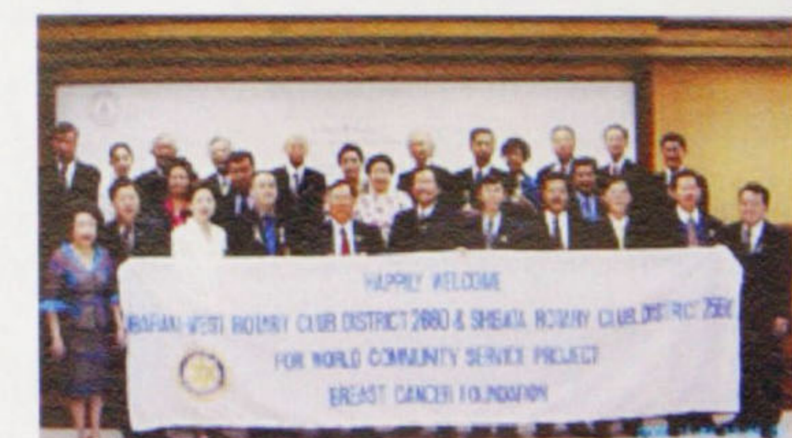
タンヤラック財団