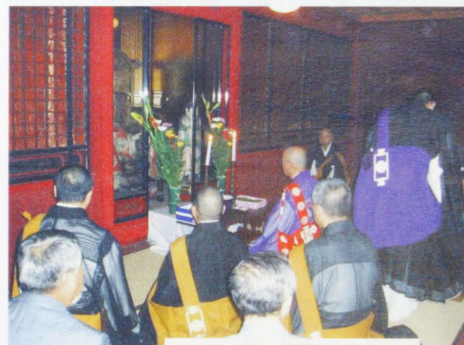
山門祈禱会：赤門の2階