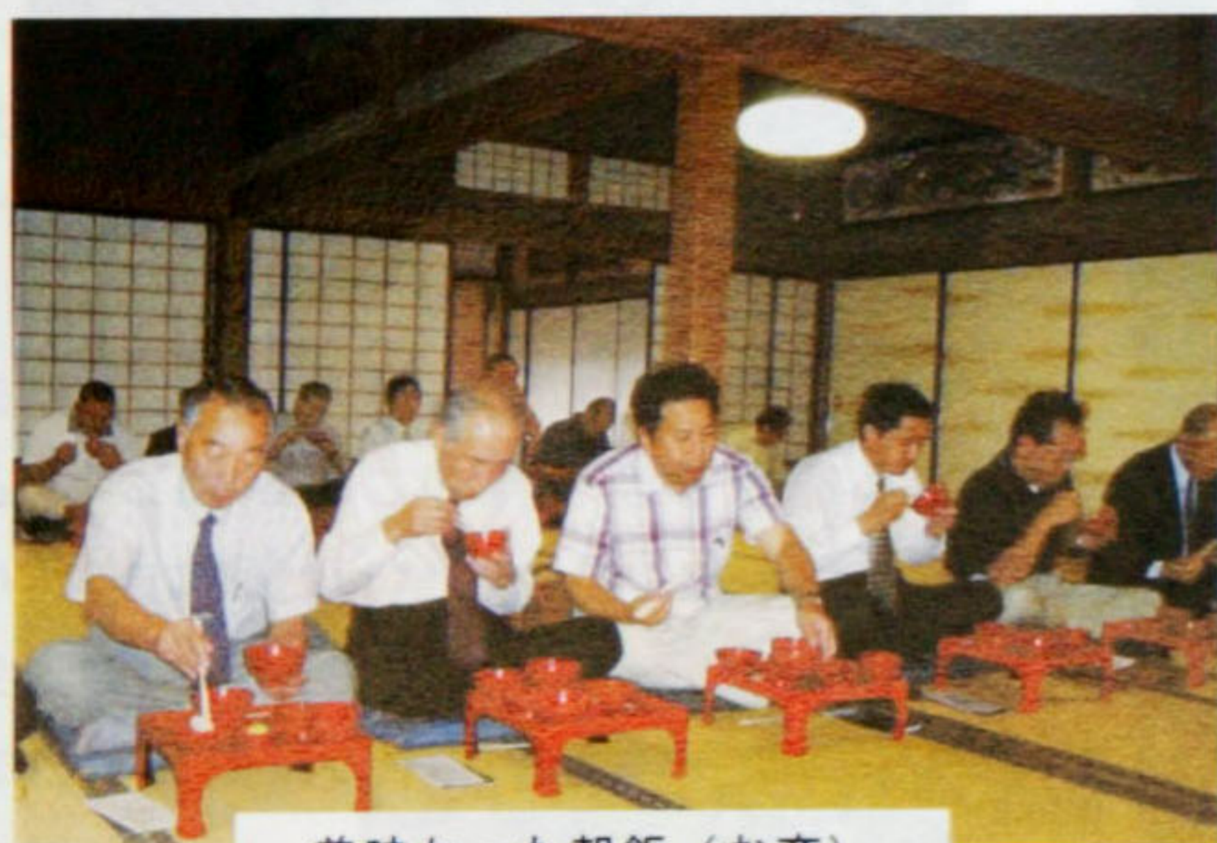
美味かった朝飯（お齊）