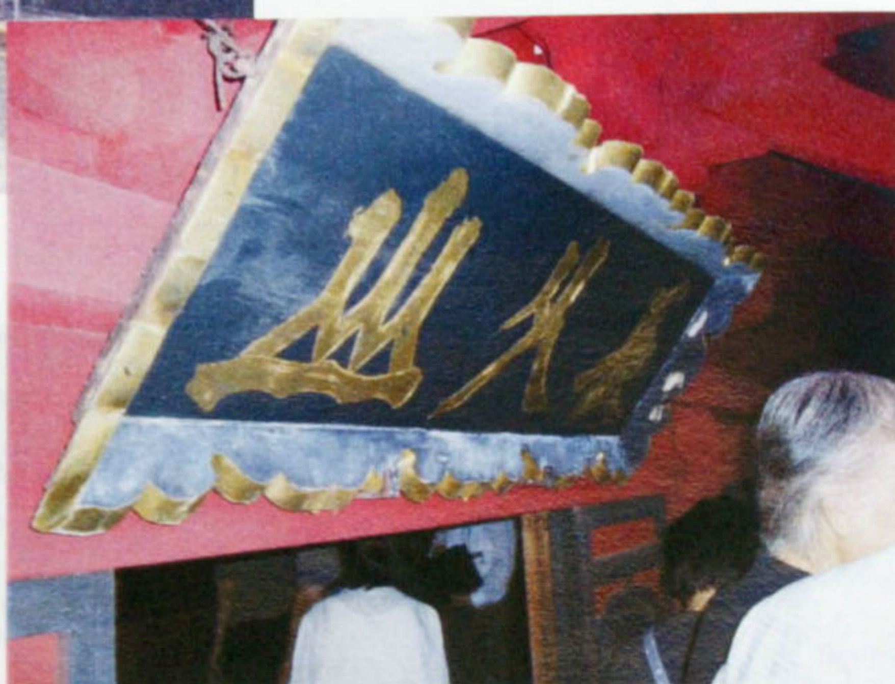
赤門に架かる「長久山」寺扁額