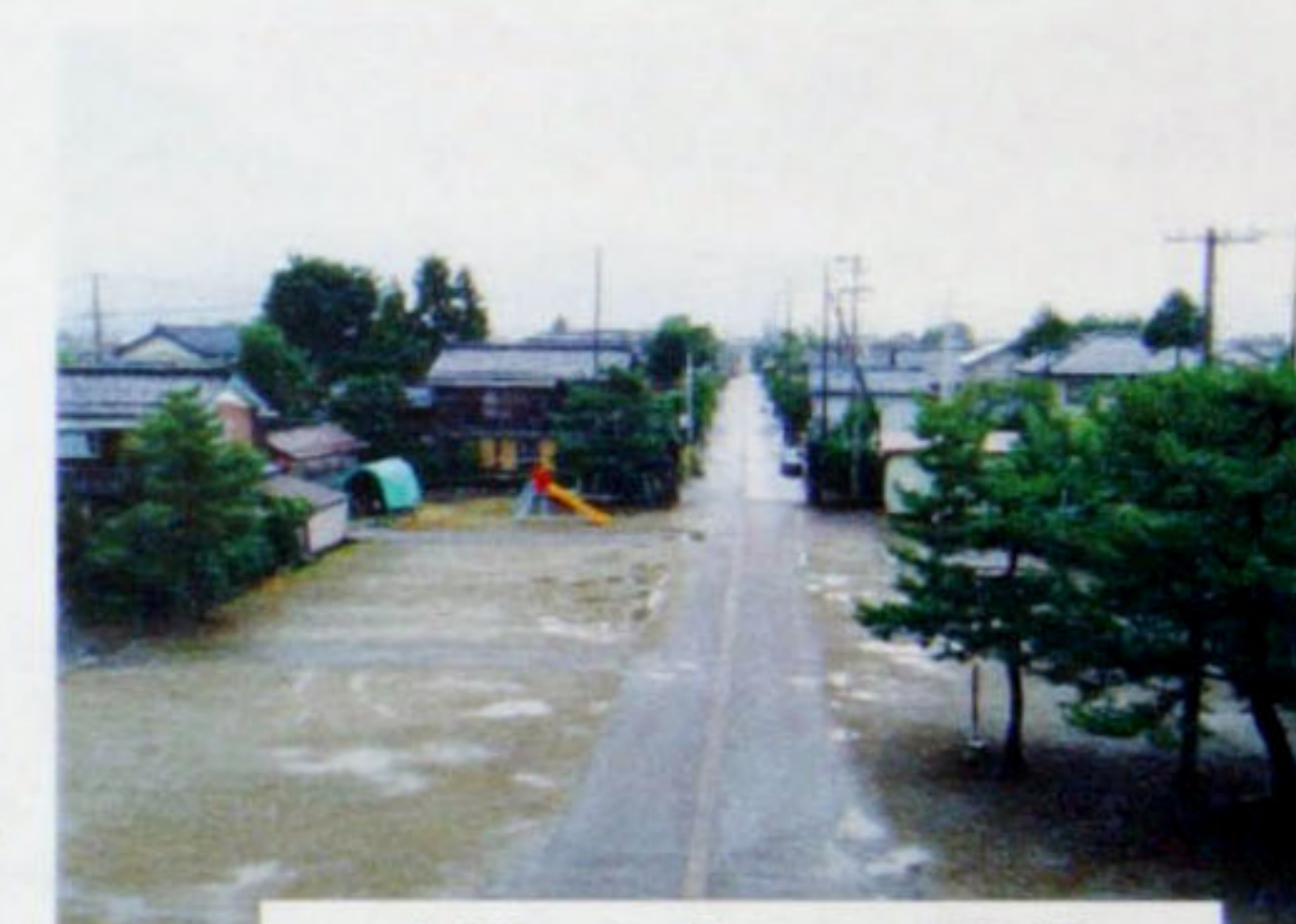
赤門の2階からの眺望