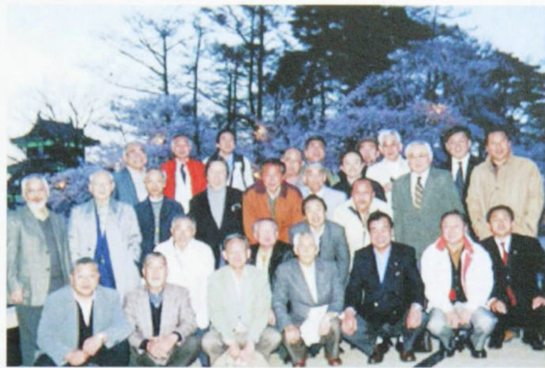
夜例会 於：上越市 デュオ・セレッソ