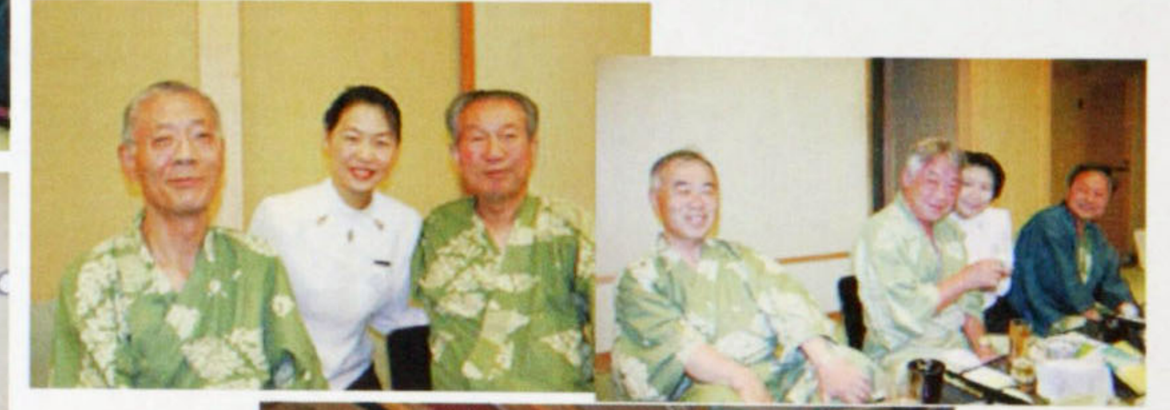
お誕生日おめでとう！