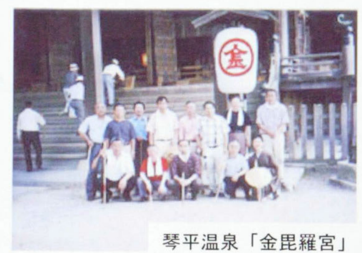
琴平温泉「金毘羅宮」