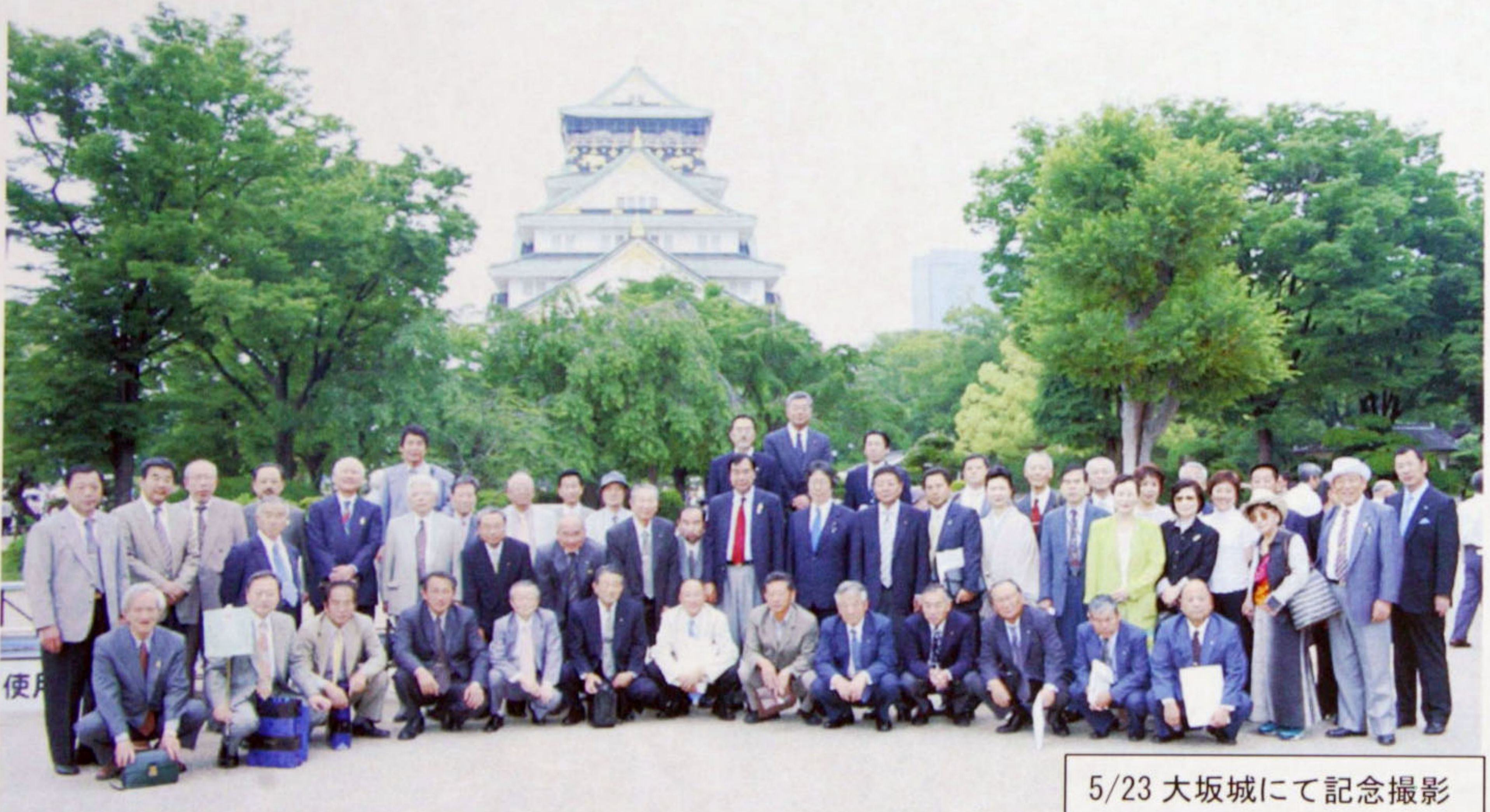
5/23 大坂城にて記念撮影