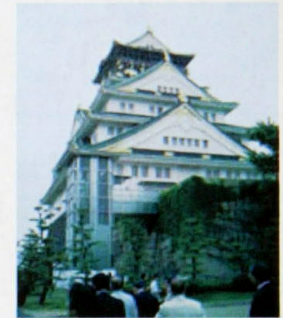
国際大会会場 大阪ドーム